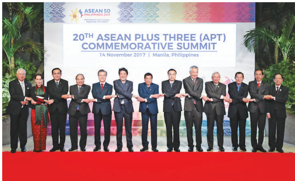
11月14日，国务院总理李克强在菲律宾国际会议中心出席第二十次东盟与中日韩（10+3）领导人会议。这是会议开始前，李克强同与会领导人合影。新华社记者 庞兴雷摄

本报马尼拉11月14日电（记者白阳、张志文）国务院总理李克强当地时间11月14日上午在菲律宾国际会议中心出席第二十次东盟与中日韩（10+3）领导人会议。东盟十国领导人以及日本首相安倍晋三、韩国总统文在寅共同出席。菲律宾总统杜特尔特主持会议。