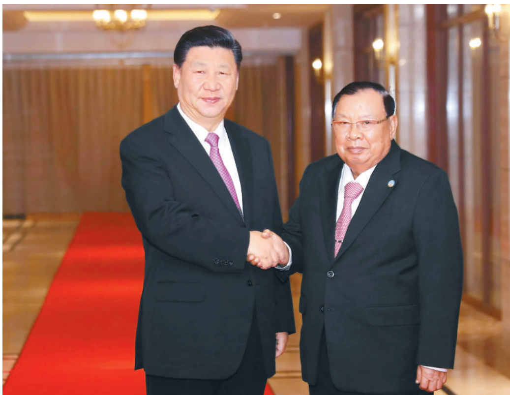
11月14日,中共中央总书记、国家主席习近平在万象下榻饭店再次会见老挝人民革命党中央委员会总书记、国家主席本扬。

本扬表示,习近平总书记、国家主席对老挝的历史性访问取得圆满成功,将长期稳定的中老全面战略合作伙伴关系提升到新水平,充分彰显两国传统友好。老挝全党和举国上下感到欢欣