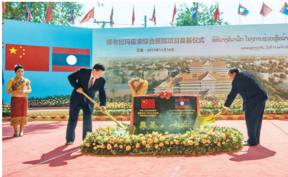
11月14日,中共中央总书记、国家主席习近平同老挝人民革命党中央委员会总书记、国家主席本扬在万象一道出席玛霍索综合医院奠基仪式。

济体,中国深知自身肩负的责任。顺应大势、勇于担当,中国将坚持走和平发展道路,始终做世界和平的坚定维护者;始终秉持正确义利观,积极发展全球伙伴关系,扩大同各国的利益汇合点,推动建设相互尊重、公平正义、合作共赢的新型国际关系;始终秉持共商共建共享理念,积极参与全球治理体系改革和建设,推动国际政治经济秩序朝着更加公正合理的方向发展,与世界各国人民一起,共同创造人类的美好明天。 大道之行,天下为公。从和平共处五项基本原则,到和平与发展两大时代主题的战略判断;从对世界经济贡献率超过30%,到提出共建“一带一路”倡议、构建人类命运共同体,中国始终为人类作出更大贡献作为自身使命。新时代的中国新征程,不仅属于13亿多中国人民,也必将为亚太和世界开拓新局面、带来新机遇、增添新动力,让人类命运共同体的美好愿景与中华民族伟大复兴的中国梦交相辉映。