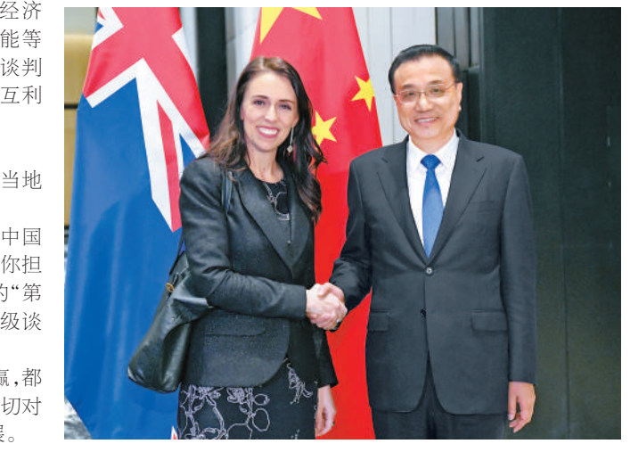
右上图:11月13日,国务院总理李克强在菲律宾马尼拉下榻饭店会见越南总理阮春福。右中图:11月13日,国务院总理李克强在菲律宾马尼拉下榻饭店会见日本首相安倍晋三。右下图:11月13日,国务院总理李克强在菲律宾马尼拉下榻饭店会见新西兰总理阿德恩。