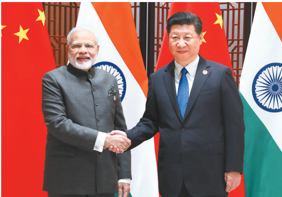
9月5日，国家主席习近平在厦门会见来华出席金砖国家领导人第九次会晤和新兴市场国家与发展中国家对话会的印度总理莫迪。