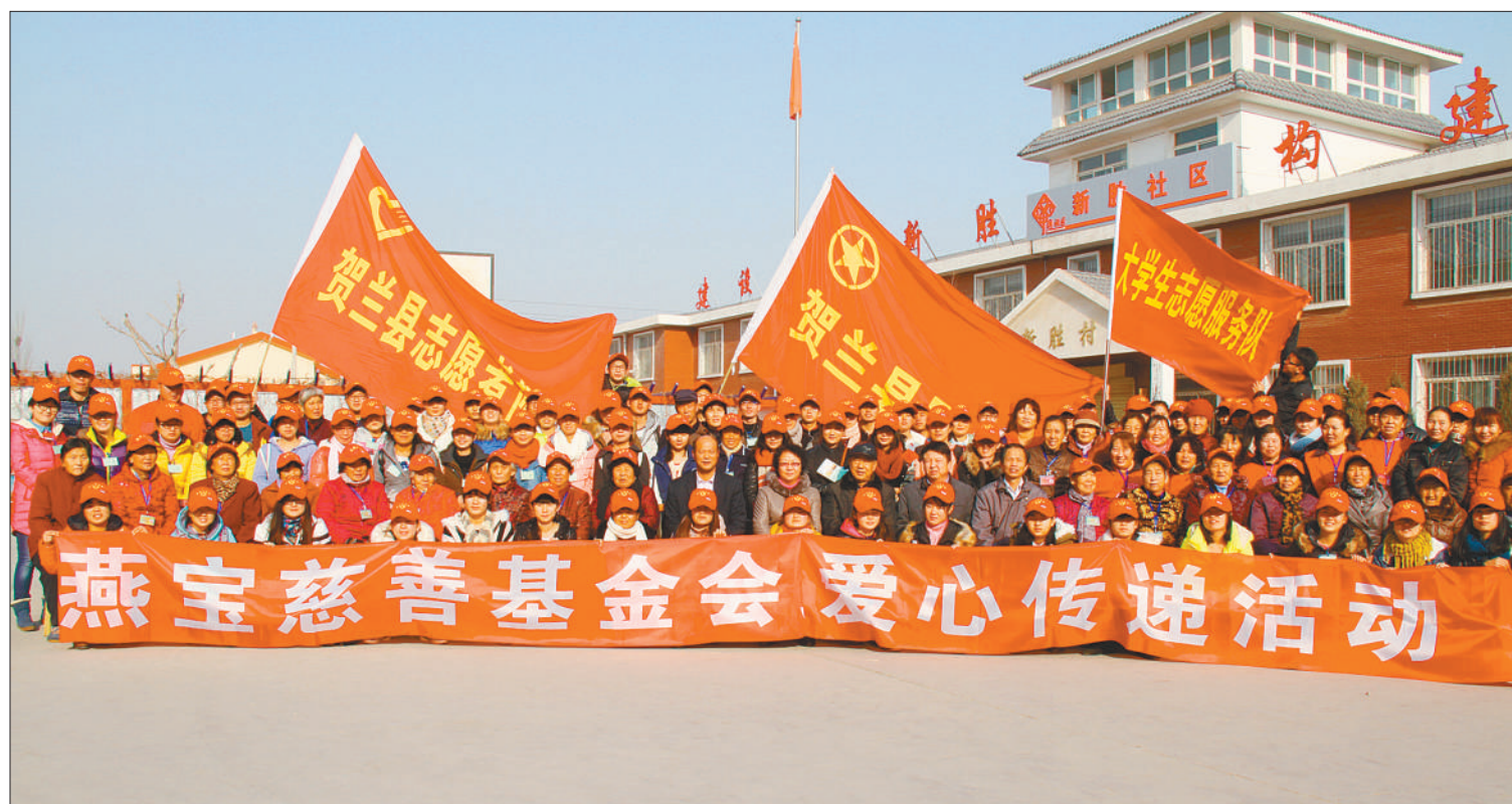
宝丰燕宝慈善基金会奖学金受助大学生赴银川市贺兰县新庄村开展志愿活动。