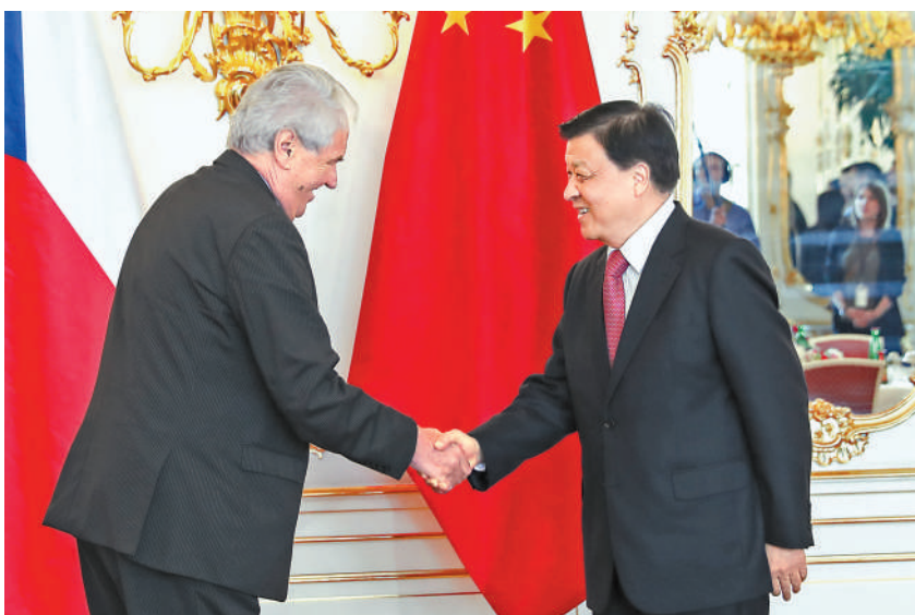
7月16日至19日，应捷克社会民主党副主席、众议长哈马切克邀请，中共中央政治局常委、中央书记处书记刘云山对捷克进行正式友好访问。这是7月18日，刘云山在布拉格会见捷克总统泽曼。

新华社布拉格7月19日电（记者李忠发）应捷克社会民主党副主席、众议长哈马切克邀请，中共中央政治局常委、中央书记处书记刘云山16日至19日对捷克进行正式友好访问，访问期间分别会见捷克总统泽曼、总理索博特卡、众议长哈马切克，并出席“2017中国投资论坛”。