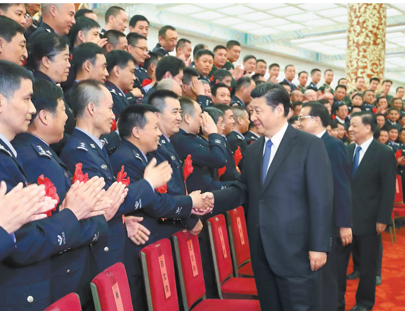
5月19日,全国公安系统英雄模范立功集体表彰大会在北京人民大会堂举行。会前,习近平、李克强、刘云山等会见与会代表。