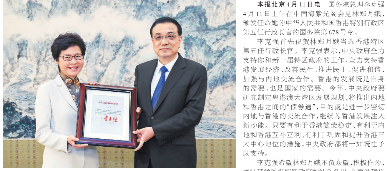
4月11日,国务院总理李克强在北京中南海紫光阁会见林郑月娥,颁发任命她为中华人民共和国香港特别行政区第五任行政长官的国务院令。