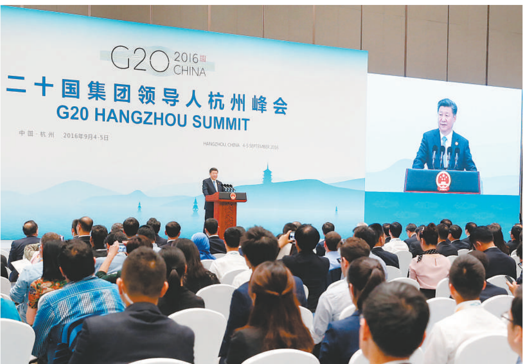
9月5日,二十国集团领导人第十一次峰会闭幕后,国家主席习近平在杭州国际博览中心会见中外记者。

本报杭州9月5日电 (记者王新萍、郭牧龙)5日,二十国集团领导人第十一次峰会闭幕后,国家主席习近平在杭州国际博览中心会见中外记者。