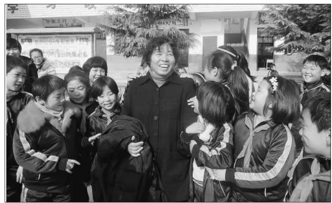
河南省扶贫办副巡视员吴树兰