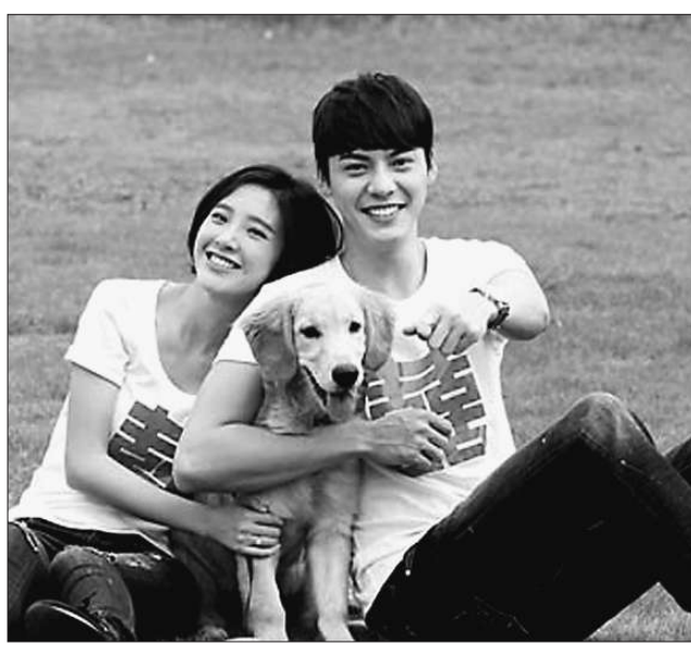
《因为爱情有幸福》剧照。资料图片

文化的大繁荣大发展，地方文化应当充当主干。激活地方国学资源，是值得积极探索和实践的时代命题。