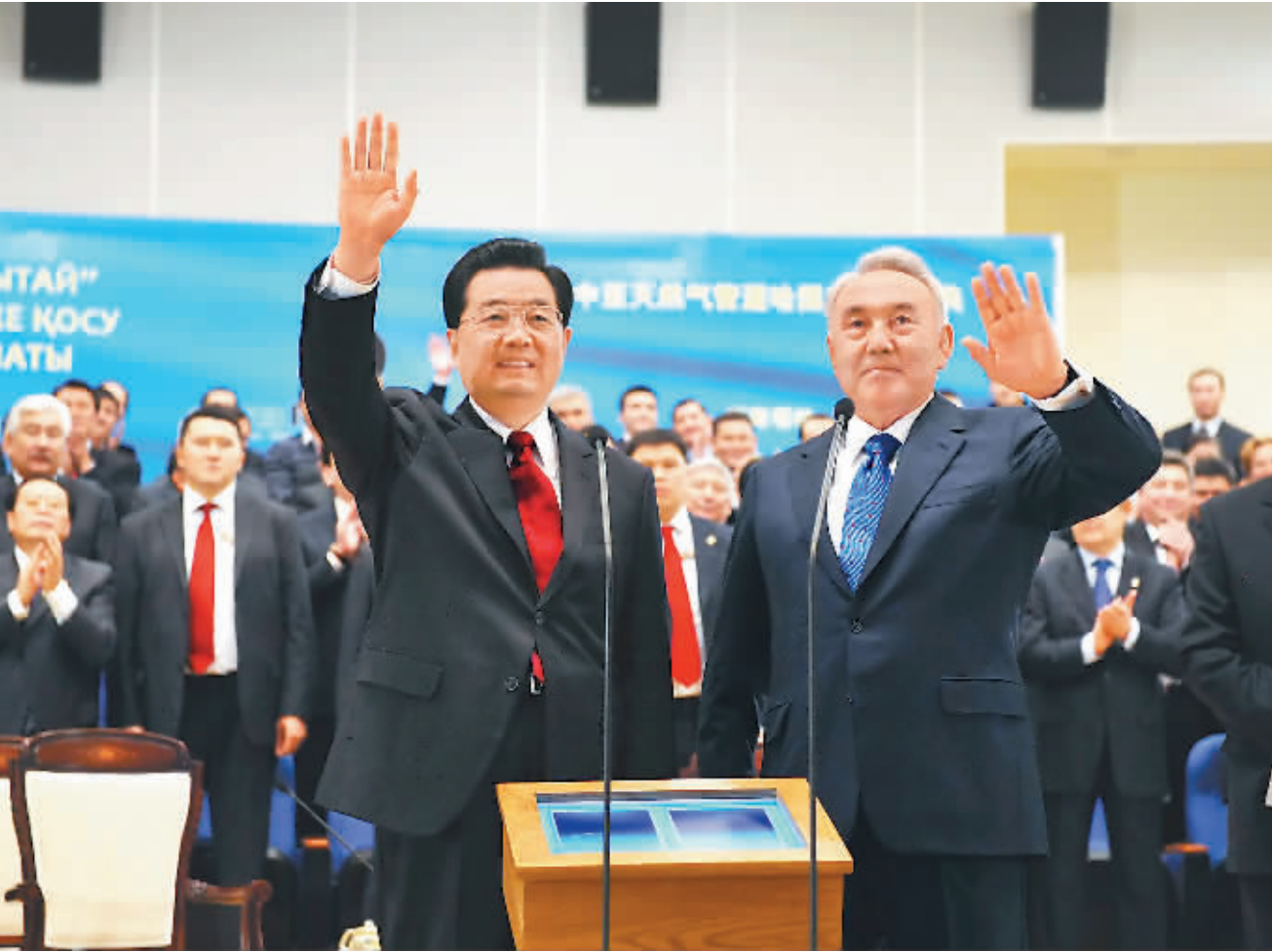
12月12日，国家主席胡锦涛在阿斯塔纳与哈萨克斯坦总统纳扎尔巴耶夫共同出席中哈天然气管道竣工仪式。这是两国元首通过视频向中哈天然气管道工程建设者招手致意。