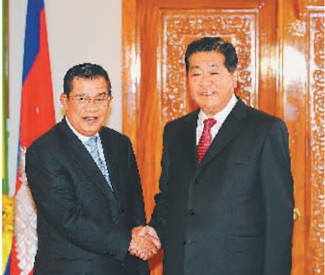
12 月 3 日，全国政协主席贾庆林在金边会见柬埔寨首相洪森。

本报金边 12 月 3 日电 （记者蒋安全）柬埔寨国王西哈莫尼 3 日在王宫会见了到访的全国政协主席贾庆林。双方在亲切友好的气氛中进行了愉快的交谈，一致表示愿进一步发展中柬世代友好关系。 贾庆林转达了胡锦涛主席对西哈莫尼国王的亲切问候。西哈莫尼国王请贾庆林转达他对胡锦涛主席的良好祝愿。 贾庆林表示，中柬友谊源远流长。建交半个世纪以来，中柬传统睦邻友好关系历久弥坚。在两国共同努力下，中柬全面合作伙伴关系不断向前发展。在中柬建交 50 周年这个具有特殊意义的年份里，我对贵国进行访问，就是为了进一步弘扬中柬传统友谊，深化互利合作，促进共