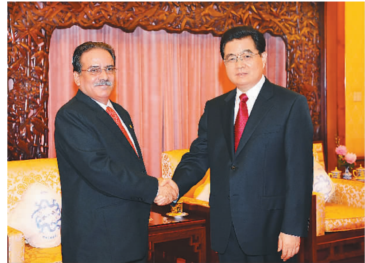
八月二十四日，国家主席胡锦涛在钓鱼台国宾馆会见前来出席北京奥运会闭幕式的尼泊尔总理普拉昌达。

北京奥运会来了！ 各国运动员来了，观众来了，记者来了，各国政要也来了！ 国家元首、政府首脑、王子、公主、部长。五大洲的，不同肤色的，100 多个国家的政要接踵而至！他们出席奥运会开幕式、闭幕式，尽享奥运精彩，为运动员们加油助威；他们同中国人民亲切交流，畅谈友谊；他们同中国领导人会晤，商讨国际大事、商讨两国关系未来…… 他们的到来是对奥林匹克运动的推动，是对体育健儿的鼓舞，是对中国人民的友善和支持。