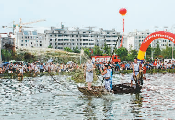
7月28日上午，江苏省洪泽县渔民在洪泽湖畔参加迎奥运军鱼大赛。洪泽湖军鱼、网捕是观赏性参与性很强的生产活动，现已成为一年一度的洪泽湖水上运动会传统趣味体育项目，正在申报国家和省级非物质文化遗产。

扎实践“诺”和正在开展的民主评“诺”，有效地推动了华亭县的经济建设和社会事业发展，为提高人民群众的生活质量奠定了基础。今年上半年，华亭县GDP同比增长21.8%；城镇居民可支配收入5202元，增长24.2%；万元工业增加值能耗下降了3.4个百分点，安全生产、环境保护都控制在规定的指标以内。