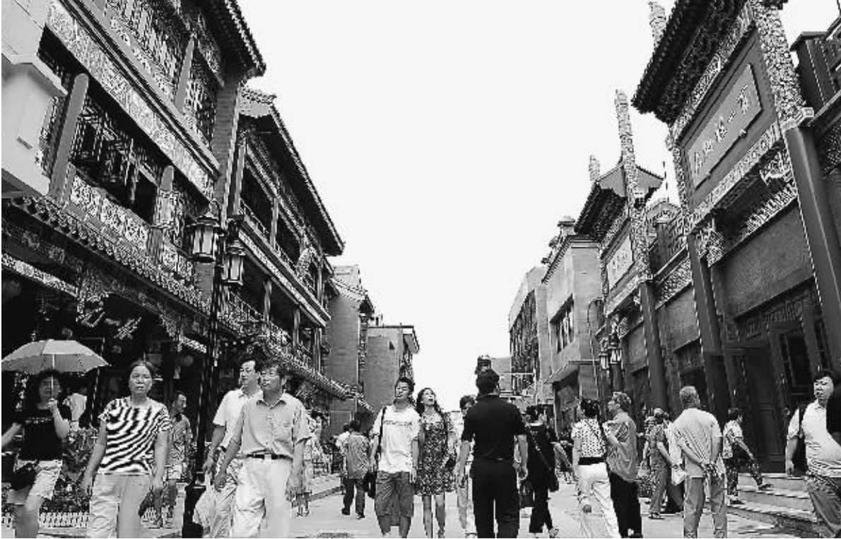
7 月 30 日,北京大栅栏商业街完成近年来规模最大的一次修缮改造工程,正式开街迎接八方来客。全长 266 米的大栅栏商业街是一条有着近 500 年历史的古老商业街,街中老字号云集、历史文化遗存集中,是北京现存的最能体现古都风貌和传统商业文化底蕴的街区之一。