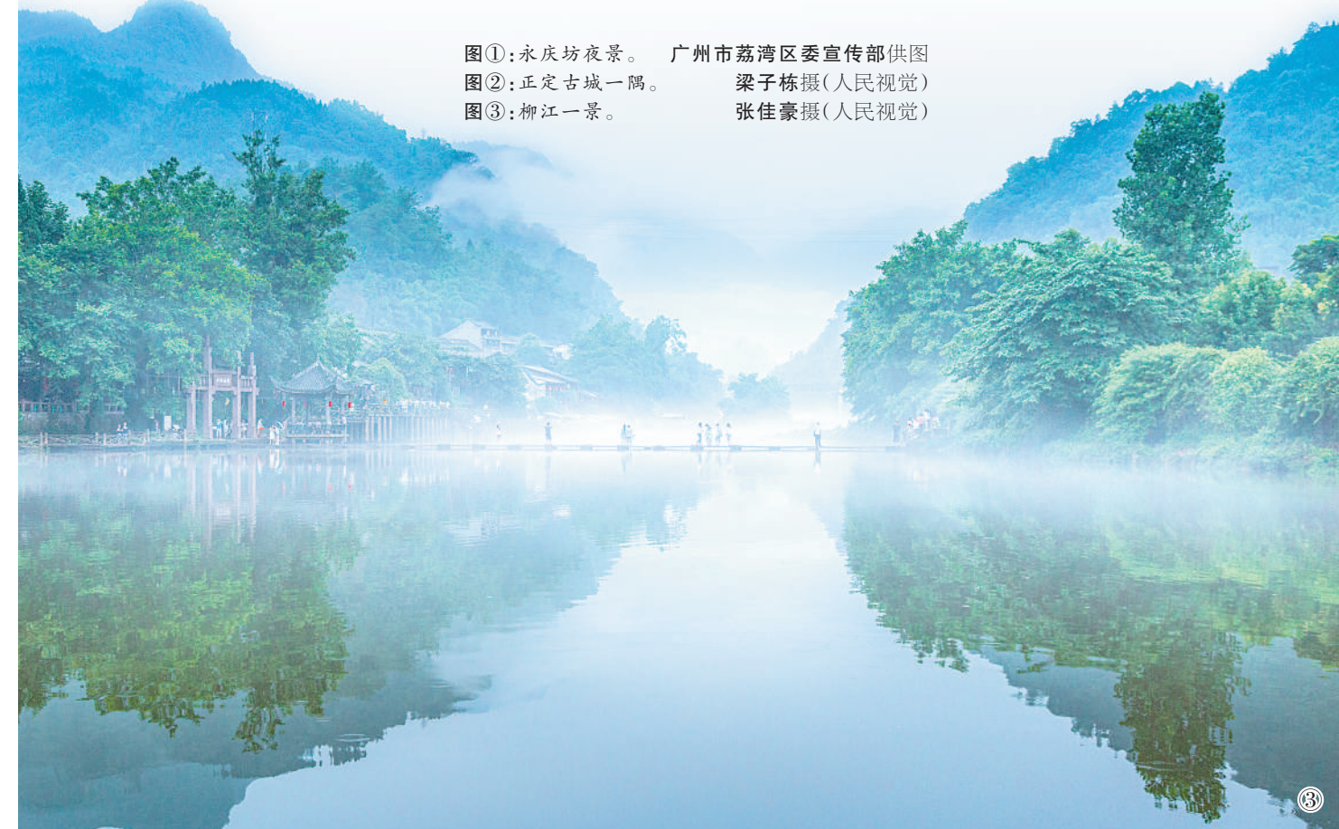
图①：永庆坊夜景。 图②：正定古城一隅。 图③：柳江一景。