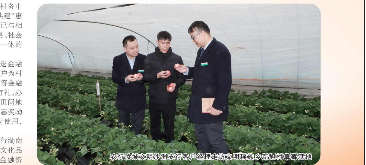
农行汝城文明沙洲支行客户经理走访文明瑶族乡新旭村草莓基地