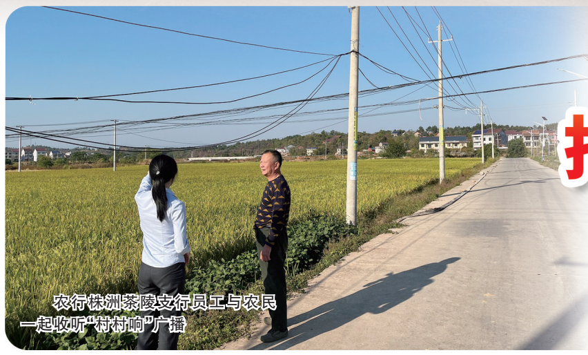
农行株洲茶陵支行员工与农民一起收听“村村响”广播