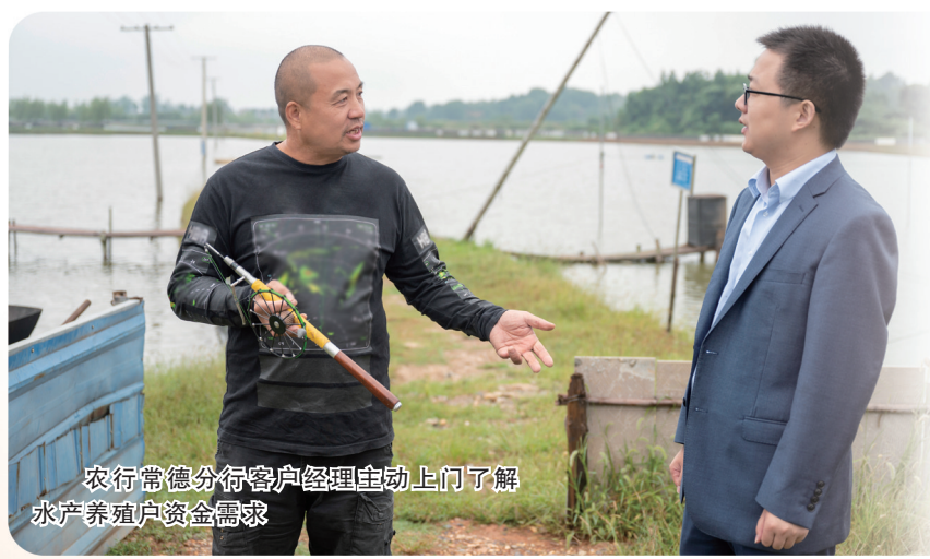
农行常德分行客户经理主动上门了解水产养殖户资金需求