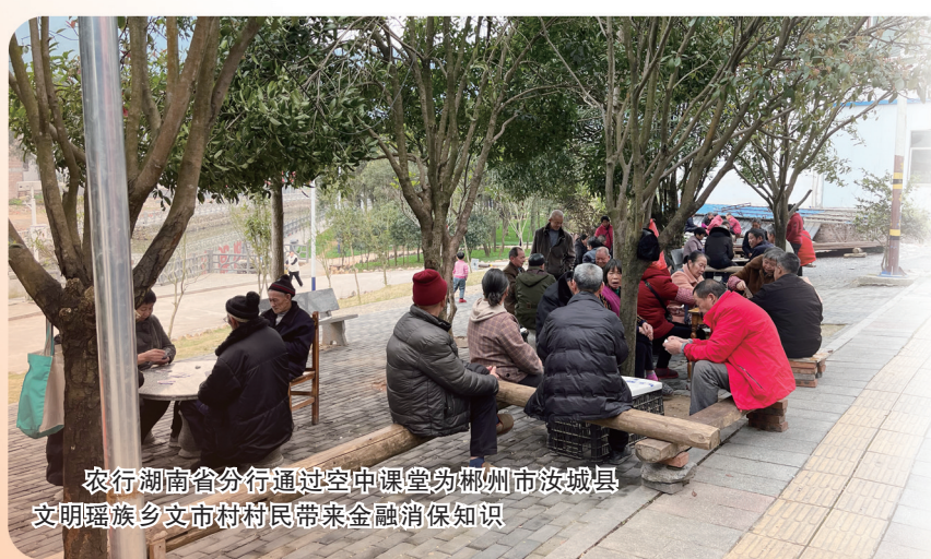
农行湖南省分行通过空中课堂为郴州市汝城县文明瑶族乡文市村村民带来金融知识

中国农业银行湖南省分行(简称“农行湖南省分行”)认真贯彻落实党中央关于推进乡村全面振兴的决策部署,围绕“建设服务乡村振兴的领军银行”定位,依托惠农品牌建设提升农村金融服务水平,创新推出“湘村振兴通”品牌,持续打造“惠农大讲堂”品牌。着力解决县域金融服务网络不广、服务能力不强、宣教培训渠道不畅、产品创新速度不快等问题,有力有效服务乡村全面振兴。