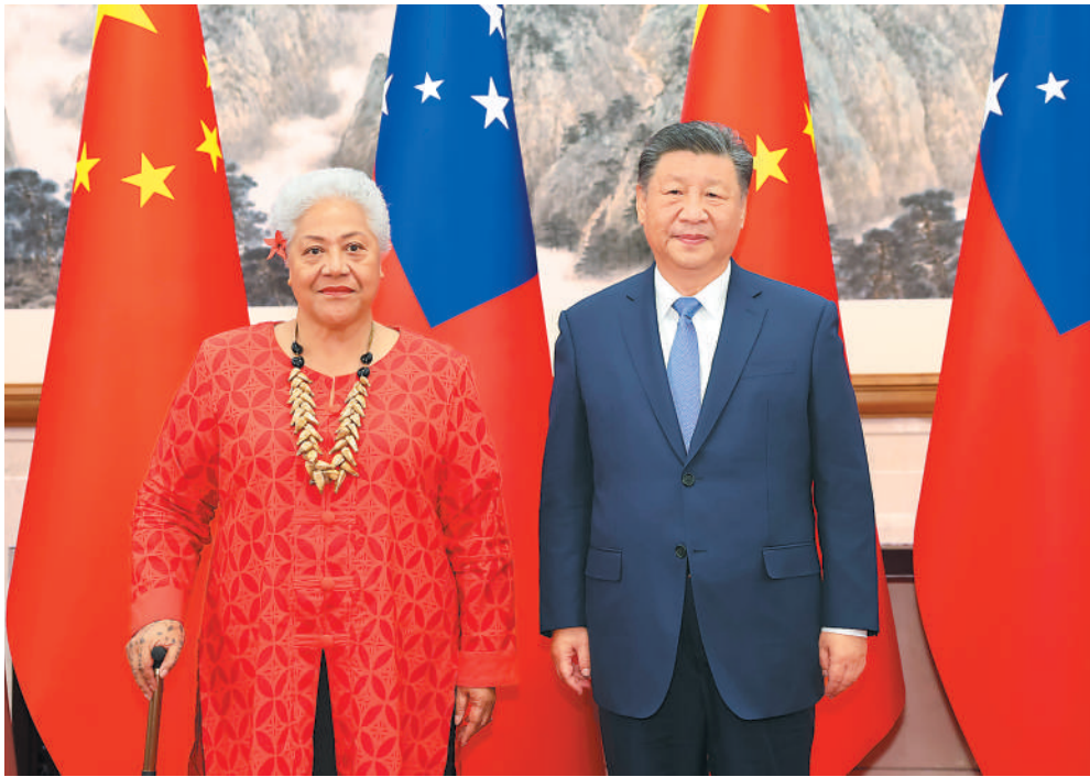
11月26日下午,国家主席习近平在北京钓鱼台国宾馆会见来华进行正式访问的萨摩亚总理菲娅梅。

新华社北京11月26日电 (记者冯歆然、曹嘉羽)11月26日下午,国家主席习近平在北京钓鱼台国宾馆会见来华进行正式访问的萨摩亚总理菲娅梅。