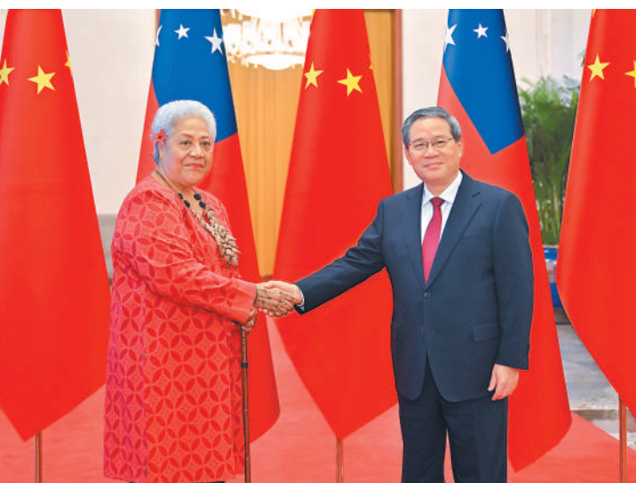
11月26日上午,国务院总理李强在北京人民大会堂同来华进行正式访问的萨摩亚总理菲娅梅举行会谈。

新华社北京11月26日电 国务院总理李强11月26日上午在北京人民大会堂同来华进行正式访问的萨摩亚总理菲娅梅举行会谈。