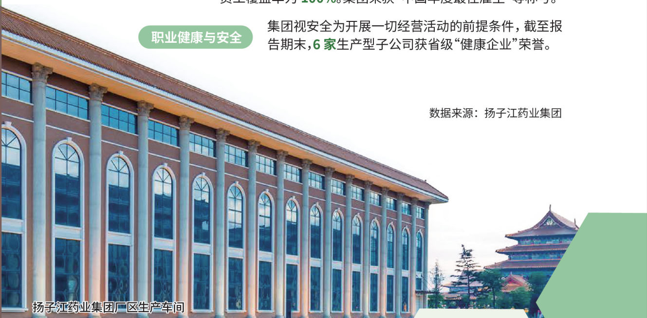
扬子江药业集团厂区生产车间