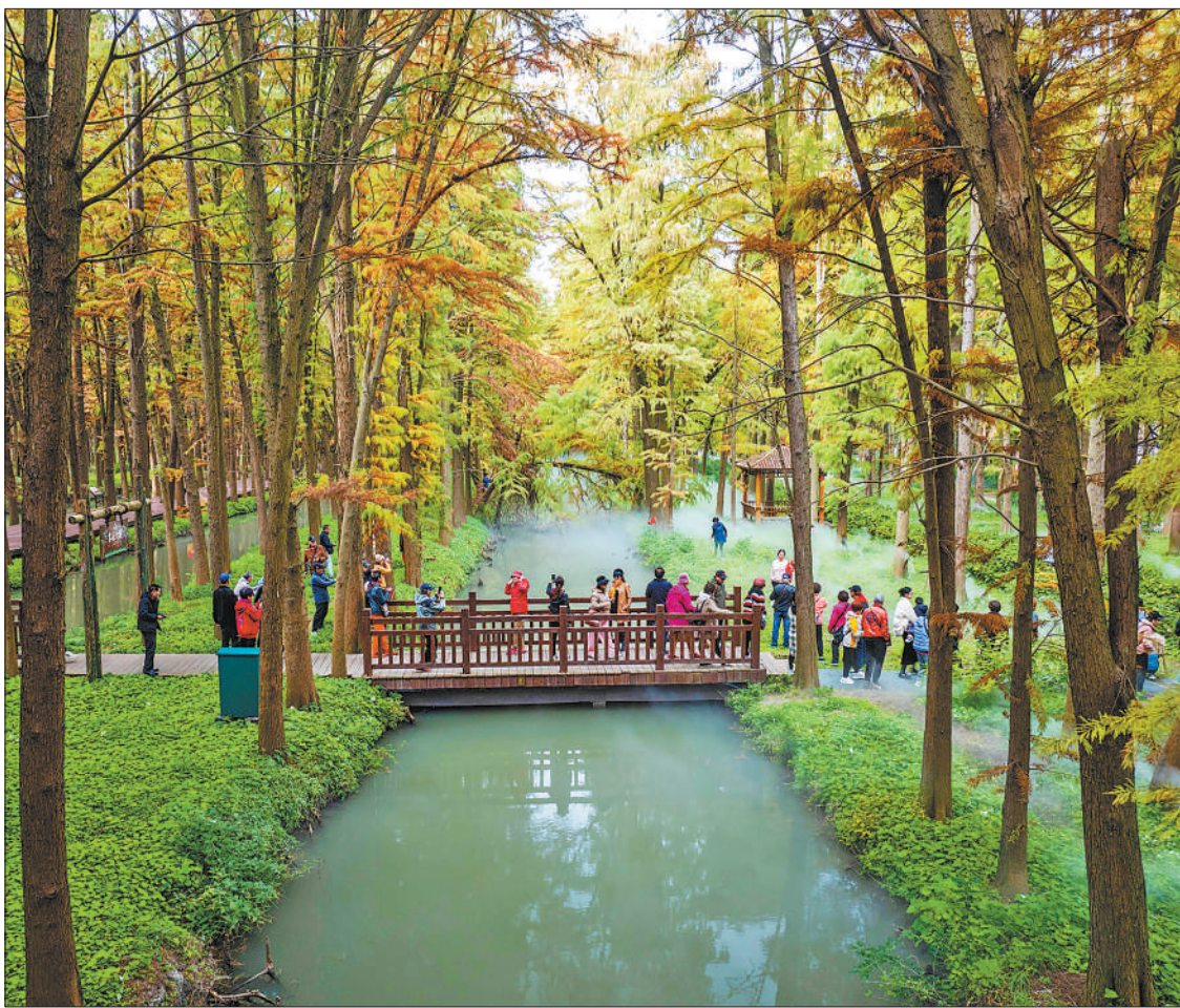
初冬时节，江苏泰州兴化市里下河国家湿地公园色彩斑斓，碧水与杉林相映成趣，呈现一幅美丽的冬日画卷。图为11月24日，游客在里下河国家湿地公园赏景游玩。