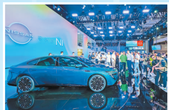
车展上,东风日产发布的纯电动汽车。