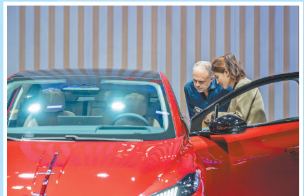
车展上,一款红旗品牌的汽车吸引了外国观众关注。

本届广州车展上,合资、外资车企带来多款新产品。越来越多的跨国车企利用中国市场、技术和制度开放等优势,实现了“在中国,为世界”的转变;与此同时,也有越来越多中国汽车品牌布局海外市场,实现从“走出去”到“融进去”。在全球化道路上,中国汽车品牌正与世界各地企业在合作中走向共赢。