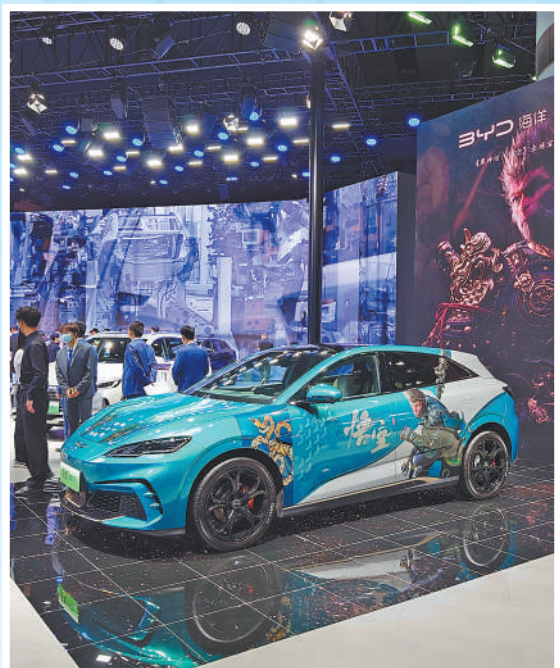
在比亚迪展台上展出的新能源汽车。

本届广州车展共有展车1171台,其中新能源汽车512台,占总展出车辆的43.7%,份额再提升。今年以来,我国新能源汽车市场规模快速增长,11月14日,新能源汽车年产量首破1000万辆,标志着我国新能源汽车产业迎来高质量发展新阶段。