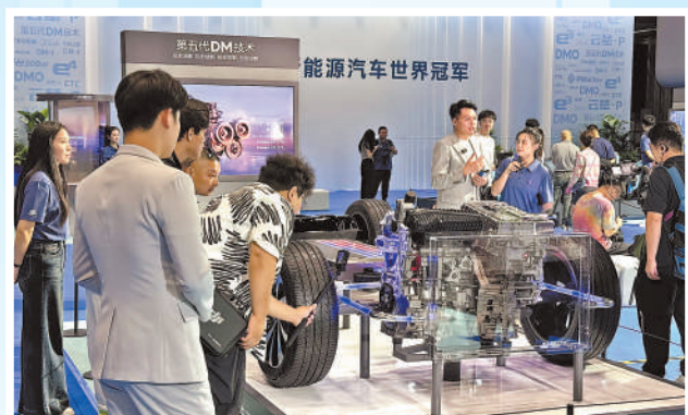
观众在车展上观看比亚迪插电混动技术展示。