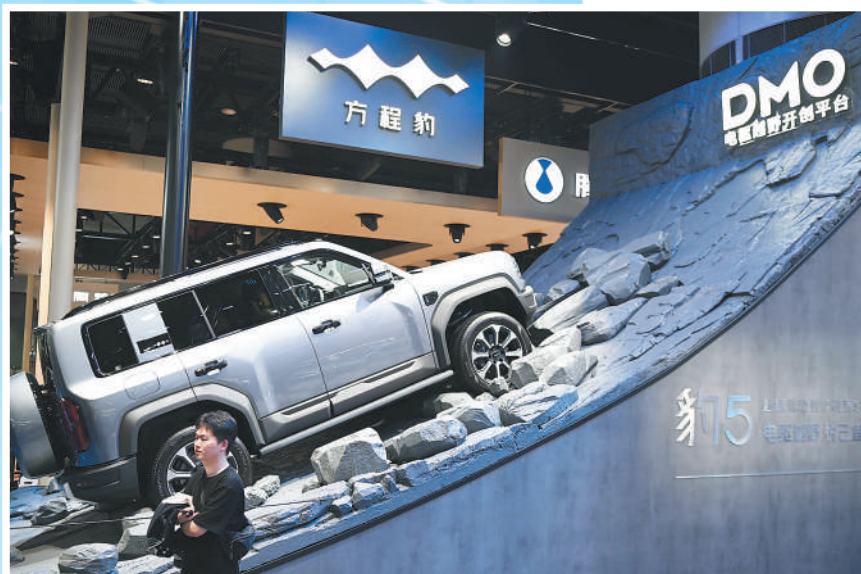
车展上亮相的方程豹新能源越野车。