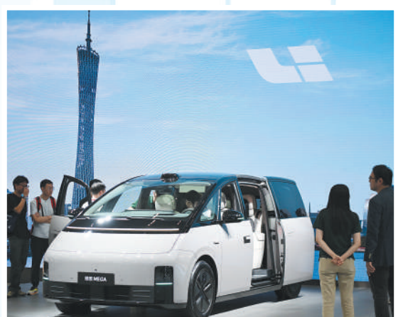
观众在参观和体验理想品牌的新能源汽车。