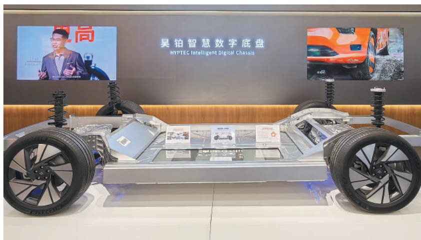
车展上,广汽埃安展示了昊铂智慧数字底盘技术。运用这一底盘技术的车辆可实现虎式调头、原地起跳。