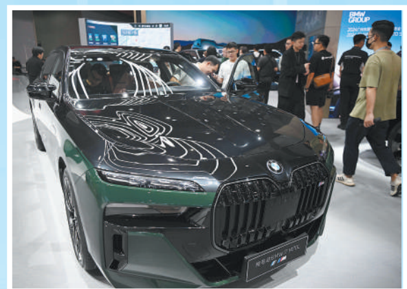
车展上展出的宝马纯电动汽车。