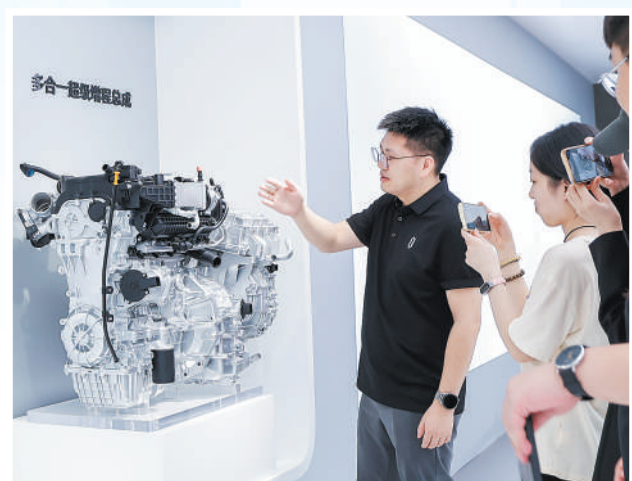
问界展台上,工作人员在介绍全新一代赛力斯超级增程系统。 李刚欣 文摄影报道