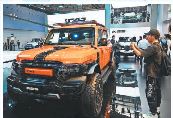
观众在奇瑞展台拍摄新能源汽车。