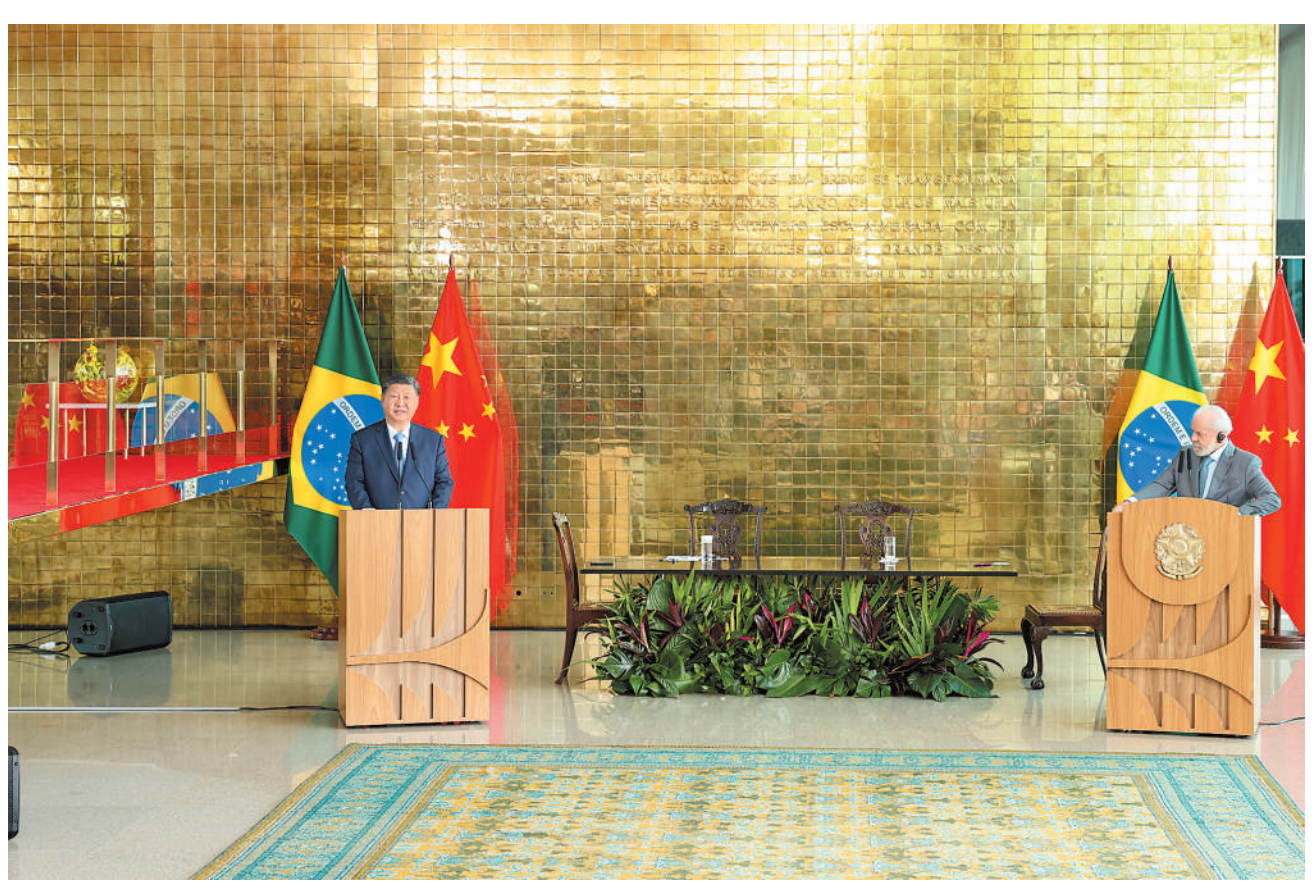
当地时间11月20日上午，国家主席习近平同巴西总统卢拉在巴西利亚总统官邸黎明宫会谈后共同会见记者。

本报巴西利亚11月20日电（记者杜尚泽、赵梦阳）当地时间11月20日上午，国家主席习近平在巴西利亚总统官邸黎明宫同巴西总统卢拉举行会谈。两国元首宣布，将中巴关系定位提升为携手构建更公正世界和更可持续星球的中巴命运共同体。 初夏时节的巴西利亚，天朗气清。黎明宫内，绿草如茵，450名威武礼兵整齐列队。在120名龙骑兵护卫下，习近平乘车抵达黎明宫前广场。 卢拉总统和夫人罗桑热拉热情迎接习近平，并为习近平举行隆重盛大欢迎仪式。 军乐团奏中巴两国国歌。两国元首一同观看仪仗队分列式。中巴儿童挥舞两国国旗热烈欢迎习近平。巴西艺术家用中文演唱《我的祖国》。 两国元首分别同对方陪同人员握手致意。 欢迎仪式后，两国元首举行会谈。 习近平指出，很高兴在中巴建交50周年这个具有重要历史意义的年份访问巴西。刚才卢拉总统为我举行最高礼遇的隆重欢迎仪式，充分体现了对中巴关系的高度重视以及对中国人民的深情厚谊，令我深受感动。中国和巴西是东西半球两大发展中国家。回首过去50年，中巴关系跨越山海，探索出发展中大国相互尊重、互利友好、合作共赢的正确相处之道。巴西是首个同中国建立战略伙伴关系的国家、首个同中国建立全面战略伙伴关系的拉美国家。近年来，在我和卢拉总统战略引领下，两国日益成为命运与共的可靠朋友、共促和平的积极力量，中巴关系正处于历史最好时期，不仅增进了两国人民福祉，也维护了广大发展中国家