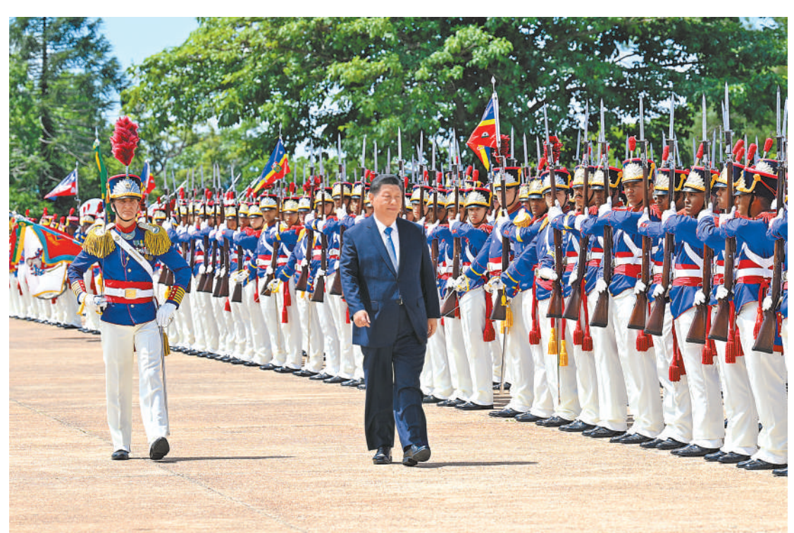
当地时间11月20日上午，国家主席习近平在巴西利亚总统官邸黎明宫同巴西总统卢拉举行会谈。会谈前，卢拉总统和夫人罗桑热拉热情迎接习近平，并为习近平举行隆重盛大欢迎仪式。