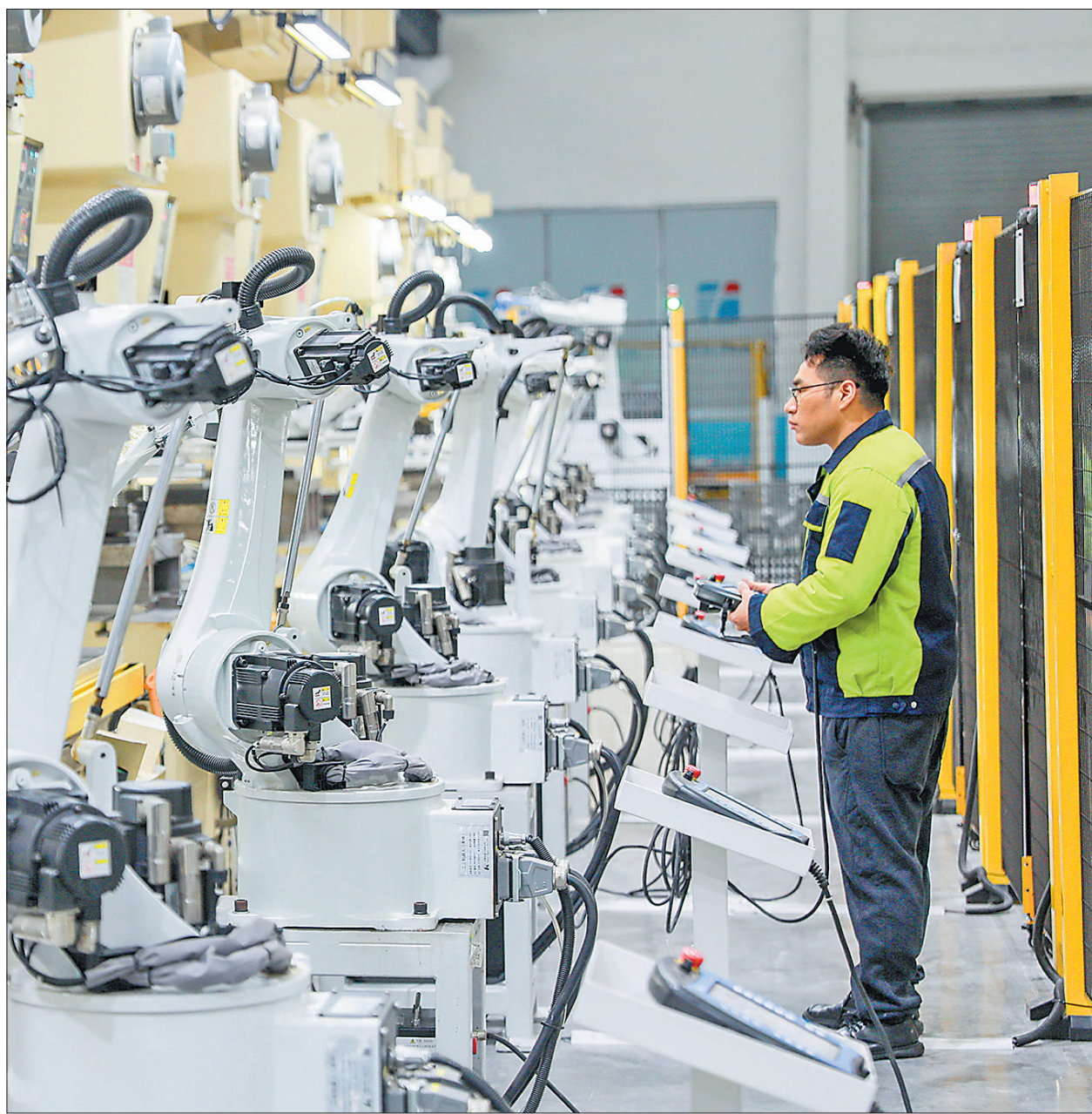
近年来,四川省华莹市把新质生产力作为深入推进新型工业化、现代化产业体系建设的着力点,支持企业智能化、数字化改造,推动高质量发展。图为华莹市一家工厂内,工作人员正在操作设备。

通知要求,省级教育行政部门和招生考试机构要加强对属地高校特殊类型考试招生工作的统筹和指导,严格审核属地高校的考试招生工作方案,强化监督检查。高校要进一步落实主体责任,认真全面总结艺术类专业、高水平运动队招生改革工作经验,优化考试及招生录取工作办法,对照有关工作规定,完善省级统考内容。各地和有关高校要加强正面宣传和政策解读,主动做好信息发布、考生提醒、咨询服务。深入开展诚信考试教育,引导考生遵守考试纪律,规范考试行为,抵制考试违纪。