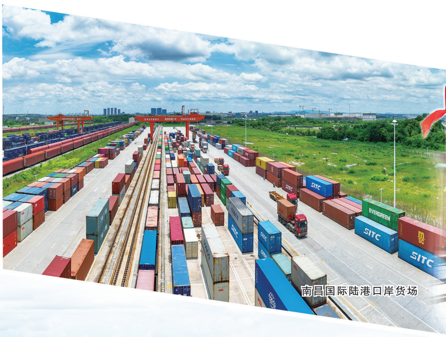
南昌国际陆港口岸货场