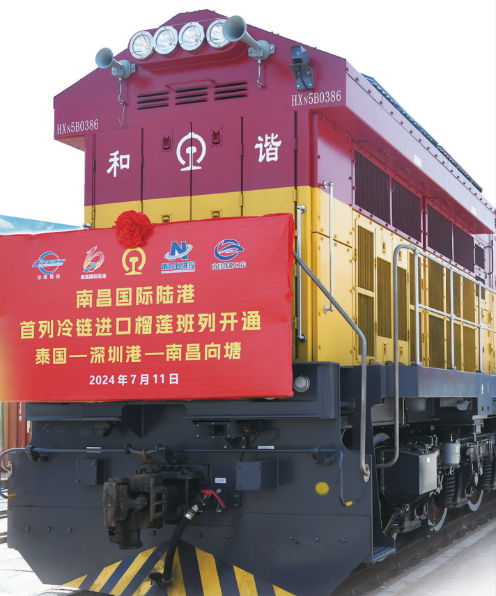
南昌国际陆港首列冷链进口榴莲班列