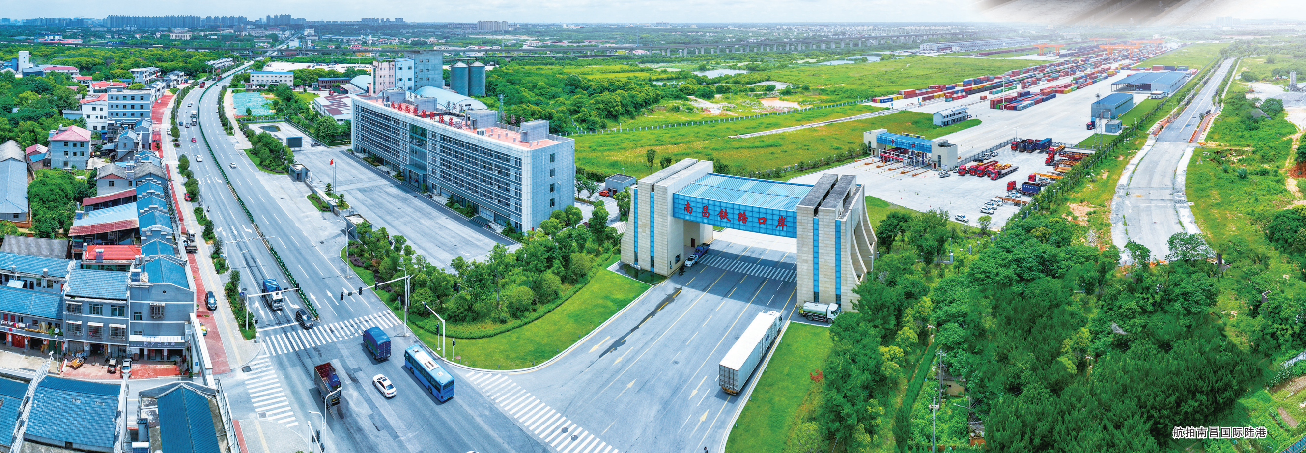
航拍南昌国际陆港