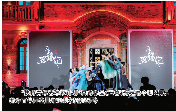
“扶持青年艺术家计划”委约作品《玉簪记》走进今潮8弄,并秀百年异兽量身定制《诗韵芭蕾》