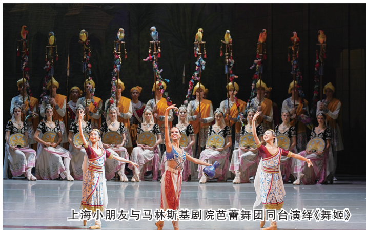
上海小朋友与马林斯基剧院芭蕾舞团同台演绎《舞姬》