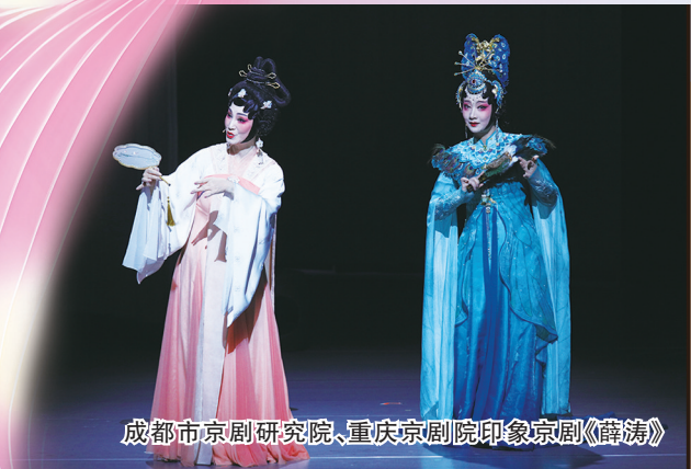
成都市京剧研究院、重庆京剧院印象京剧《薛涛》

第23届中国上海国际艺术节 THE 23RD CHINA SHANGHAI INTERNATIONAL ARTS FESTIVAL