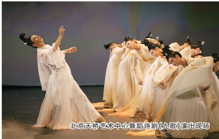
北京天桥艺术中心舞蹈诗剧《九歌》演出现场