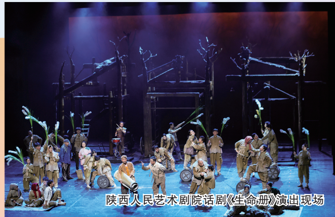
陕西人民艺术剧院话剧《生命册》演出现场