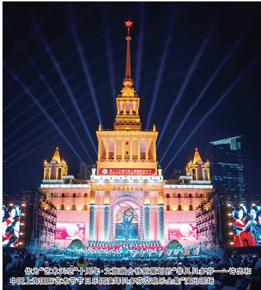
作为“艺术天空”十周年·文旅融合特别策划的“非凡贝多芬——许忠和中国上海国际艺术节节日乐团演绎贝多芬交响乐全集”演出现场