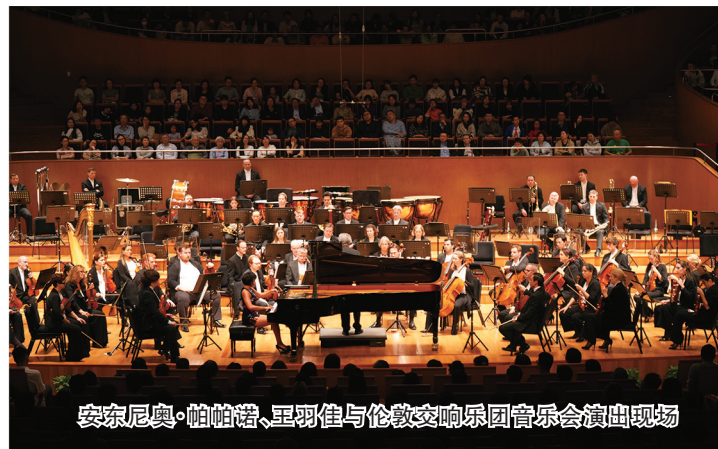
安东尼奥·帕帕诺、里羽佳与伦敦交响乐团音乐会演出现场