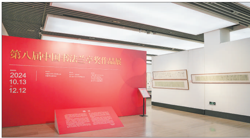
本届兰亭奖的获奖作品中，草书的创作尚需深入，书法家仍需持续提升创造性转化能力和综合人文素养。