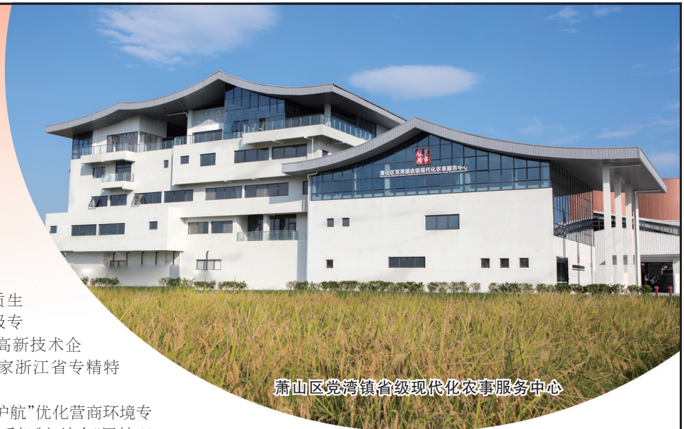
萧山区党湾镇省级现代化农事服务中心