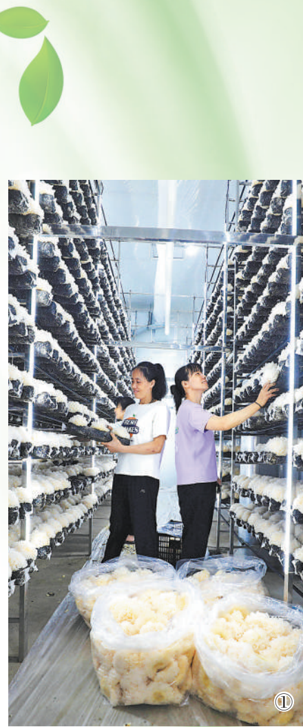
图①：村民在下党食用菌生产基地工作。 图②：村民在采摘猕猴桃。 图③：外国游客在下党乌金陶作坊体验陶艺制作。 图④：下党新村风景。

下党乡之变，关键在于用好了产业振兴这支画笔。发力茶叶、水果、食用菌等特色产品，写好“特”字文章，以产兴村；建立专业合作社联合社等组织，发挥协同效应，以产