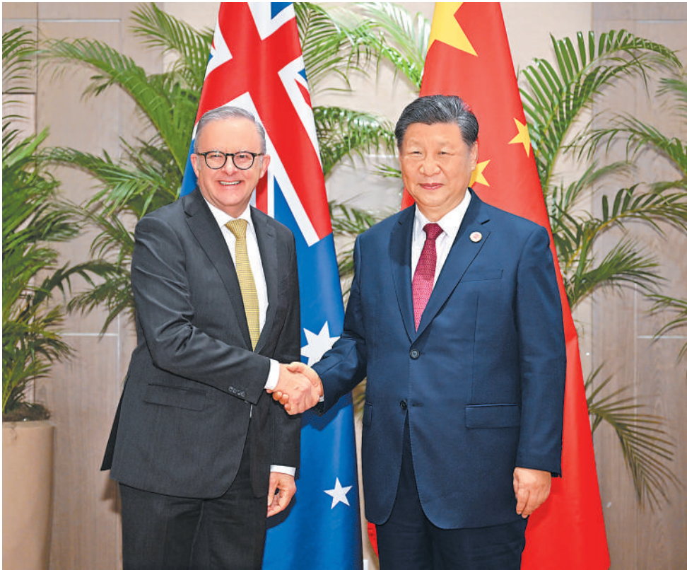
当地时间11月18日上午，国家主席习近平在里约热内卢出席二十国集团领导人峰会期间会见澳大利亚总理阿尔巴尼斯。

能够发展好。中方愿同澳方一道，推动建设更加成熟稳定、更加富有成果的中澳全面战略伙伴关系，为地区和世界注入更多稳定性和确定性。 习近平指出，250多家澳大利亚企业参加了今年的中国国际进口博览会，创下历史新高，这是澳方企业对中国经济和两国合作投下的“信任票”。双方要坚持拓展互利共赢的合作格局。中方愿进口更多澳大利亚优质产品，鼓励中国企业赴澳投资兴业，希望澳方为中国企业提供公平、透明、非歧视的营商环境。中澳都是经济全球化和自由贸易的支持者、维护者，双方应该加强协调和合作，反对保护主义，推动各国在开放中分享机会和利益，实现共同发展。 阿尔巴尼斯表示，很高兴在澳中全面战略伙伴关系建立十周年之际再次同习近平主席会面。自我去年访华以来，澳中关系在包括贸易在内的各领域取得令人鼓舞的进展，为两国人民带来实实在在的利益。澳方坚持奉行一个中国政策，反对“脱钩”，主张推进经济全球化，希望同中方加强在能源转型、气候变化等方面合作。中国发展是亚太地区长期保持稳定和增长作出重要贡献，澳方赞赏中国在亚太经合组织等多边机制发挥的重要作用，支持中国担任2026年亚太经合组织东道主，愿同中方加强多边沟通，促进地区和平稳定和繁荣发展。 蔡奇、王毅等参加会见。