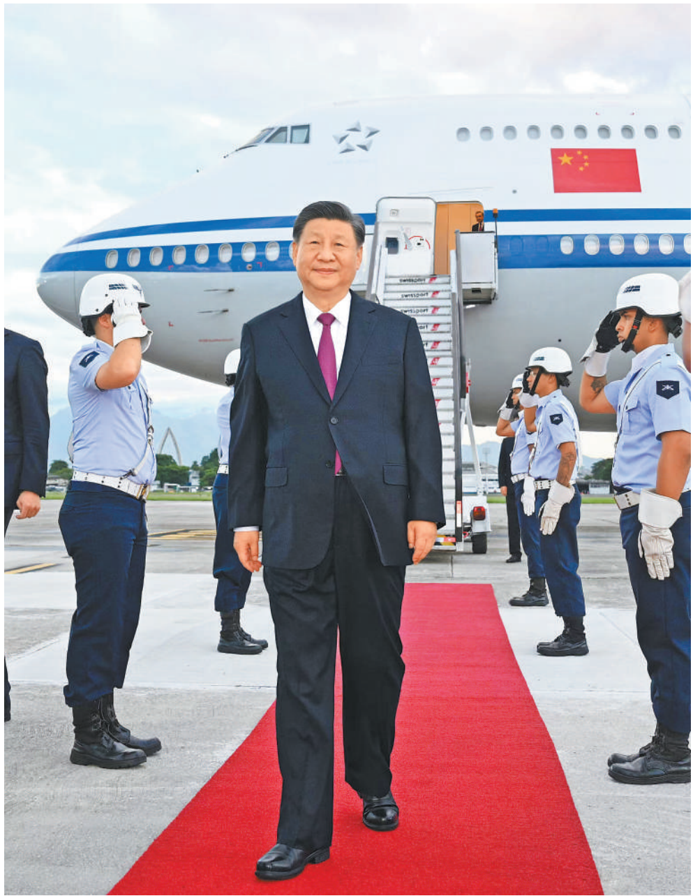
当地时间11月17日下午，国家主席习近平乘专机抵达里约热内卢，应巴西联邦共和国总统卢拉邀请，出席二十国集团领导人第十九次峰会并对巴西进行国事访问。

本报里约热内卢11月17日电（记者侯露露、马菲）当地时间11月17日下午，国家主席习近平乘专机抵达里约热内卢，应巴西联邦共和国总统卢拉邀请，出席二十国集团领导人第十九次峰会并对巴西进行国事访问。 专机抵达里约热内卢加里昂空军基地时，巴西政府高级官员热情迎接。巴西空军军号吹奏致敬，礼兵分列红毯两侧。习近平发表机场书面讲话，向巴西政府和巴西人民致以诚挚问候和良好祝愿。 习近平指出，我曾4次到访巴西，亲眼见证了巴西近30年来的发展变化，再次踏上这片热情的土地，我倍感亲切。中国和巴西是志同道合的好朋友、携手前行的好伙伴。作为东西半球