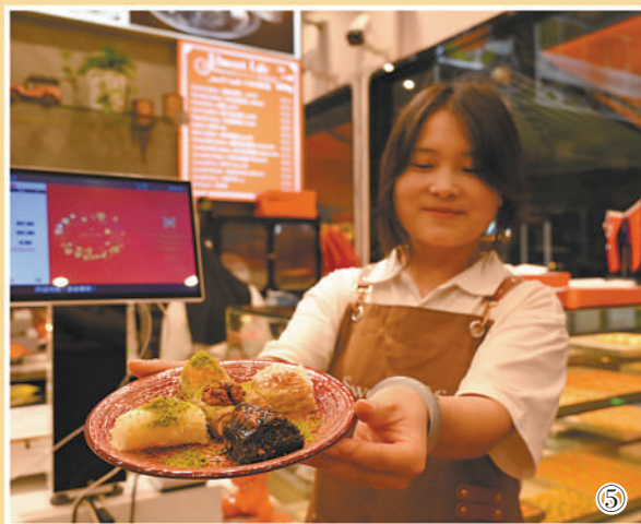
图⑤：义乌一家土耳其甜品店内，店员展示特色甜品巴克拉瓦。