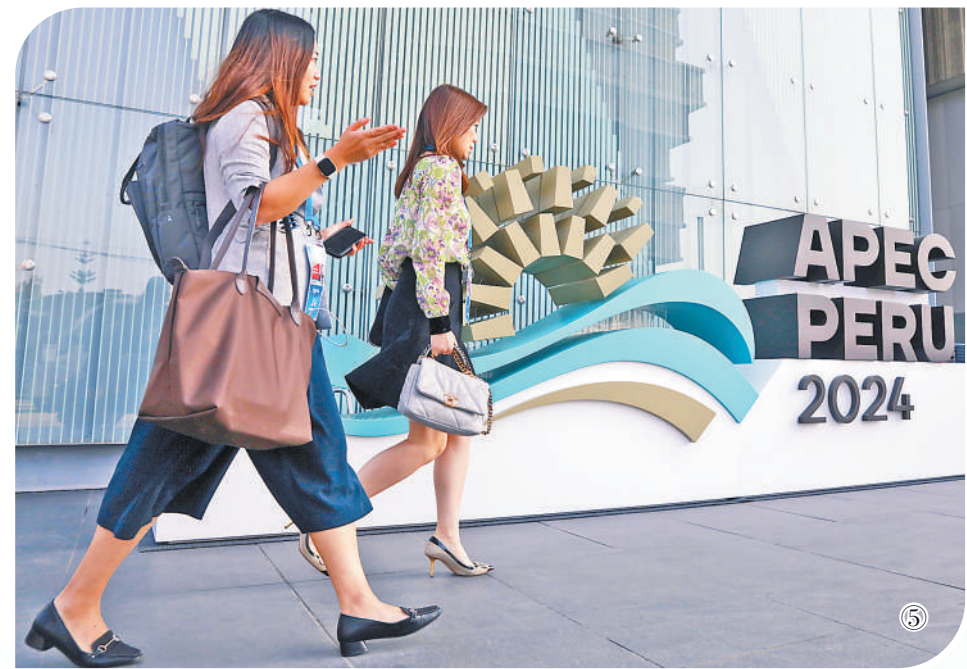
图①：亚太经合组织工商领导人峰会会场外标识。图②：2024年亚太经合组织会议新闻中心。图③：2024年亚太经合组织会议新闻中心外景。图④：中秘建设者在中铁二十局承建的秘鲁安第斯国家公路施工现场。图⑤：人们从2024年亚太经合组织会议标识前走过。图⑥：亚太经合组织工商领导人峰会会场远景。

浩瀚的太平洋，汇聚千流、连通四海。只要践行开放联通精神，太平洋就能变为促进繁荣增长的通道。亚太伙伴应把握时代大势，加强团结合作，共迎全球性挑战，携手推进共同繁荣，开创人类更加美好的未来。