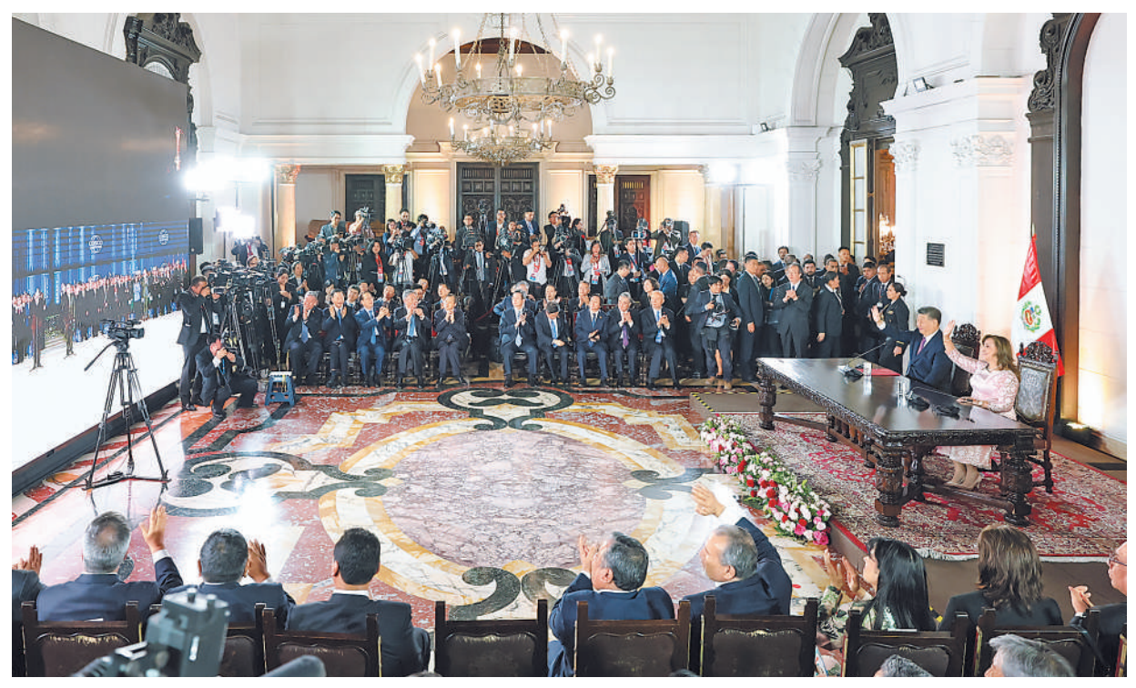
当地时间11月14日晚，国家主席习近平同秘鲁总统博鲁阿尔特在利马总统府以视频方式共同出席钱凯港开港仪式。