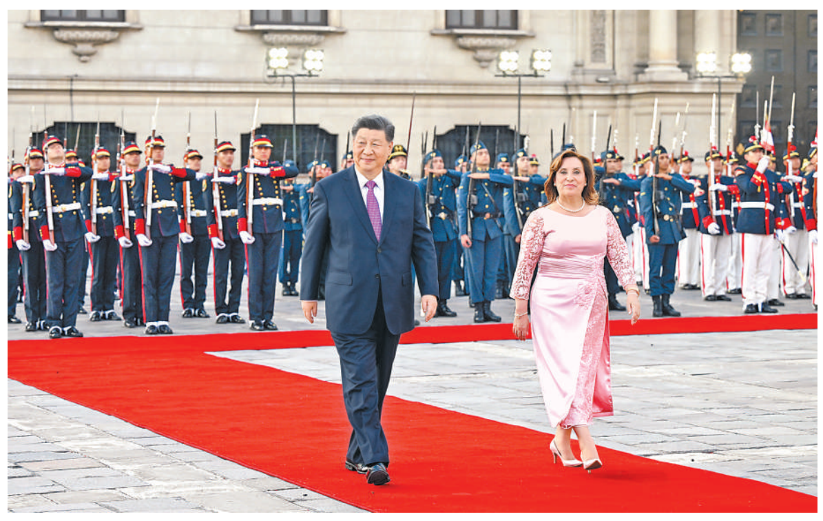
当地时间11月14日下午，国家主席习近平在利马总统府同秘鲁总统博鲁阿尔特举行会谈。博鲁阿尔特在总统府前广场为习近平举行隆重盛大欢迎仪式。