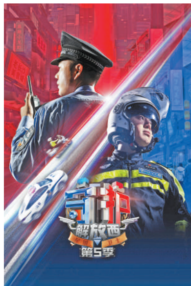
纪录片《守护解放西》第五季海报