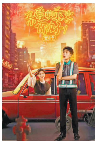
微短剧《亲爱的乘客你你好》第二季海报