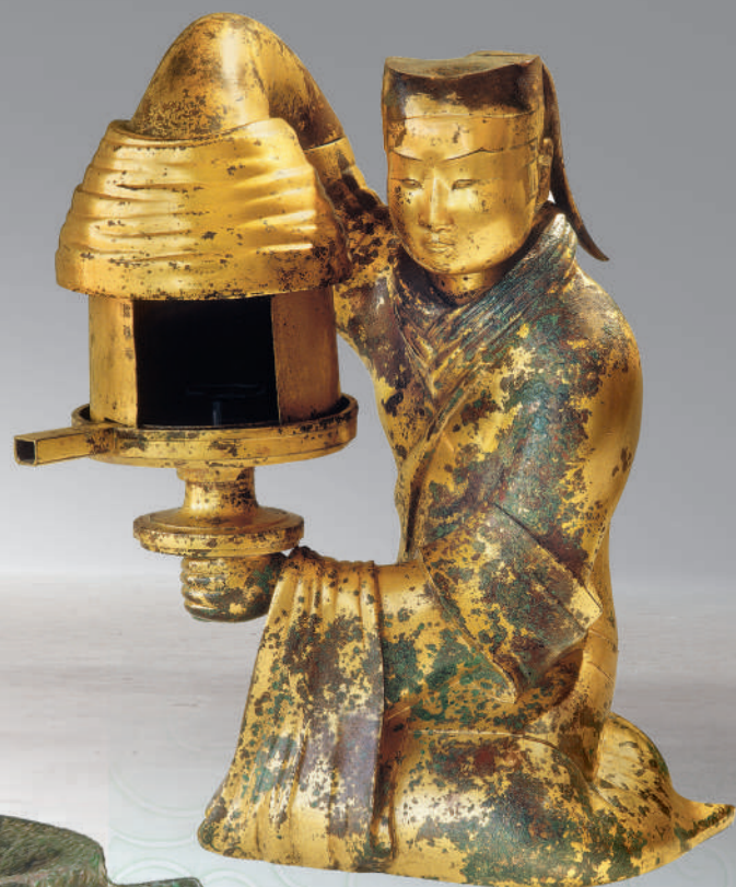
▲长信宫灯。1968年出土于河北保定满城汉墓,形状为跪地执灯的宫女,通体鎏金。灯盘可转动,以调节灯光亮度和照射方向,灯身人物中空的衣袖和身体作为通道用于排烟。