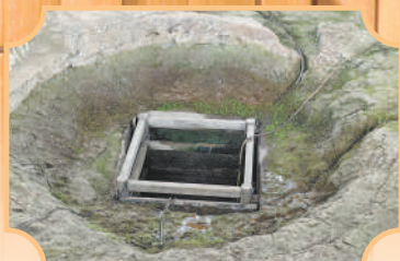
▲出土秦简的湖南龙山县里耶古城一号井。