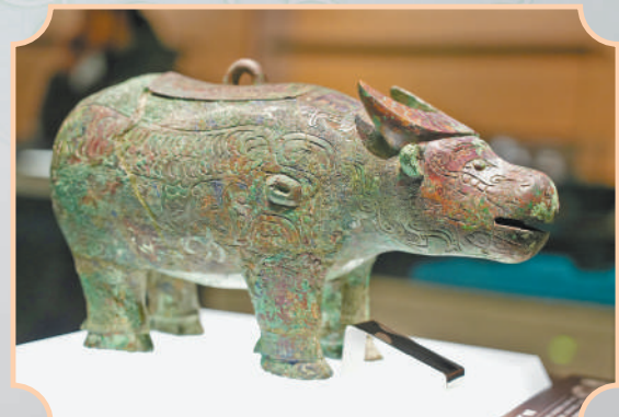
▲河南安阳殷墟博物馆内展出的亚长牛尊,是目前殷墟发现的唯一一件牛形青铜尊。