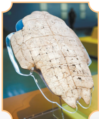
▲河南安阳殷墟博物馆展出的刻辞甲骨。甲骨文是迄今为止中国发现的年代最早的成熟文字系统,具有重要文化价值。