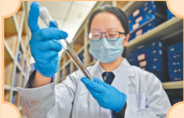
▲甘肃简牍博物馆的工作人员在文物库房内查看简牍保存情况。新华社记者 陈斌摄