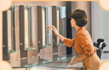
▲湖北孝感云梦县博物馆,市民正在参观简牍展。