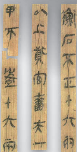
▲湖北孝感云梦县睡虎地秦简。1975年,睡虎地秦简出土,震惊世界,其中秦律十八种填补了秦代法律文书记载的空白。