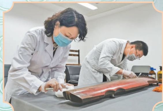
▲辽宁省博物馆工作人员在对九霄环佩琴进行保养。九霄环佩琴制作于唐代。在古琴琴底,镌刻着“九霄环佩”四个字。琴面上,镶嵌着13个由蚌壳制成的圆点,起到标记琴弦音位的作用。