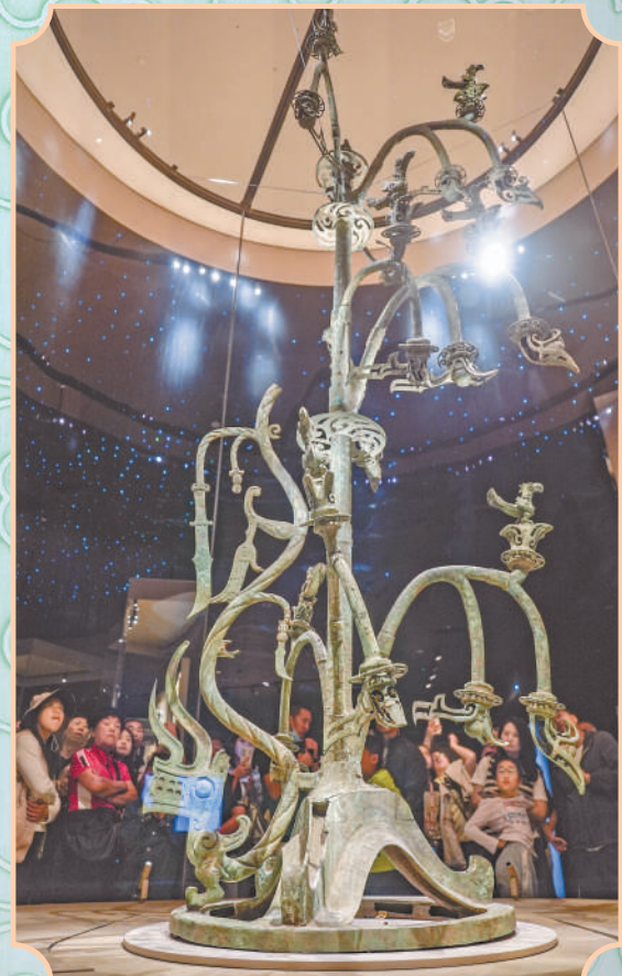
▲四川广汉三星堆博物馆内,观众围在1号大型铜神树前仔细观看。1号大型铜神树由底座、树和龙三部分组成,体现了高超的冶铸技术和艺术水平。