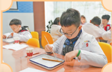
▲孩子们在湖南长沙简牍博物馆参与“探秘简牍的清洗与保护”活动。