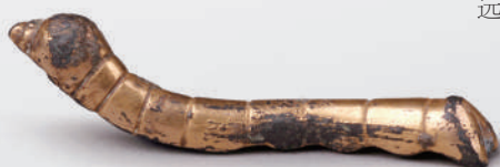
▲漆金铜蚕。1984年出土于陕西西安康石泉县,体态为蚕仰头或吐丝状,制作精致,造型逼真,见证了开辟丝绸之路的历史。