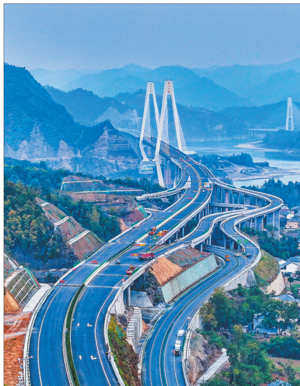
日前,位于湖北省十堰市郧阳与郧西间的十巫北高速(湖北十堰至重庆巫溪)汉江特大桥完成99%的总投资建设,即将竣工通车。

不少企业已将眼光投向一年后的第八届进博会。记者从中国国际进口博览局了解到,第八届进博会筹备工作已全面铺开,新签企业展览面积超过10万平方米。