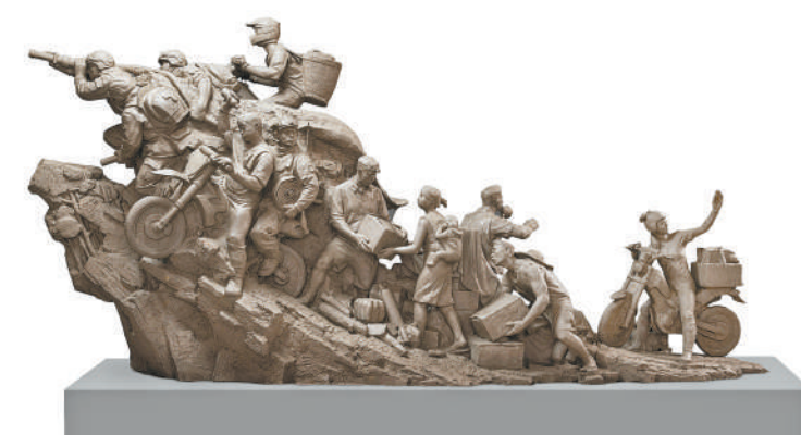
▼雕塑《缙云之巅》,作者焦兴涛、李震、尹代波、廖登海。