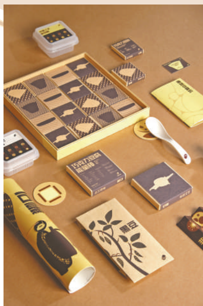
▲平面设计《榆林豆腐坊》,作者李琳岚、麻佳玉。