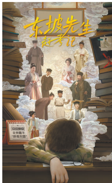
微短剧《东坡先生赶考记》海报