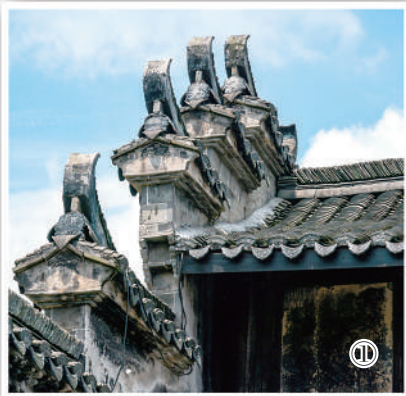
古村新生 游人如织

古樟树也承载着浓浓的乡愁与希冀。樟，与“章”同音，又有着“文章、崇学”的寓意。因此，人们也总是把樟树视作“栋梁之树”“希望之树”。据村里人介绍，岸边有一棵古樟树，多次遭遇雷击火烧，几近死亡，又奇迹般枯木逢春。这棵古树，树干中空，能容数人，外形老态而又显生机，如同一棵天然盆景，别有一番生趣。几个世纪以来，古樟捍卫着堰堤，成为一道独特的风景。