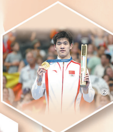
图②：潘展乐在巴黎奥运会颁奖仪式上。