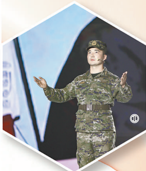
图①：阿斯哈尔·努尔太在活动现场宣讲。

“新时代新征程，南开大学将积极探索网络思政育人新模式，引导青年学生将小我融入大我，立志为中华之崛起而读书，努力为推进强国建设、民族复兴伟业贡献青春力量。”南开大学党委书记杨庆山表示。