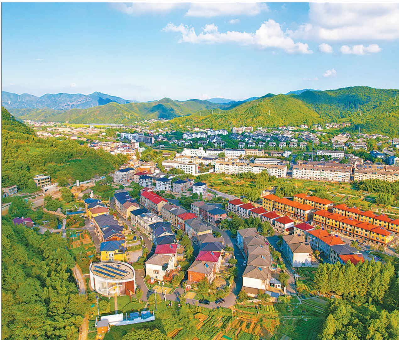
浙江省湖州市安吉县天荒坪镇余村村聚焦绿色低碳发展,推进创建“零碳”乡村。安吉县供电公司在地建设未来乡村绿电服务中心,通过综合能源管控系统智能管控屋顶光伏、移动储能、充电桩等设备。图为安吉县的余村村和山河村。

中国贸促会会长任鸿斌表示,中国贸促会是中国知识产权事业的重要开拓者和建设者,在服务中外企业、促进国际合作、推动创新发展等方面发挥了重要作用。中国贸促会将充分发挥联通政企、融通内外、畅通供需功能,在推进高水平开放、服务高质量发展中主动作为,为推动世界知识产权事业不断向前发展贡献智慧和力量。