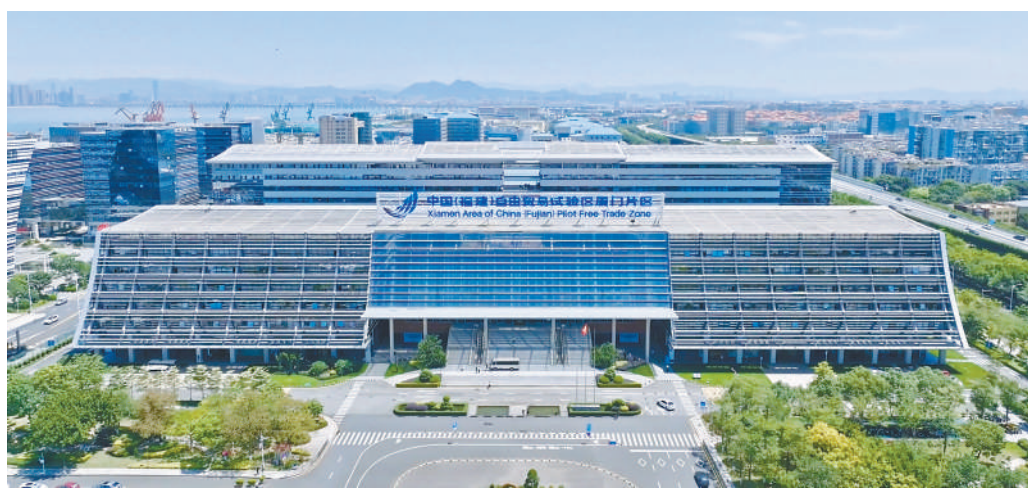
中国(福建)自由贸易试验区厦门片区。