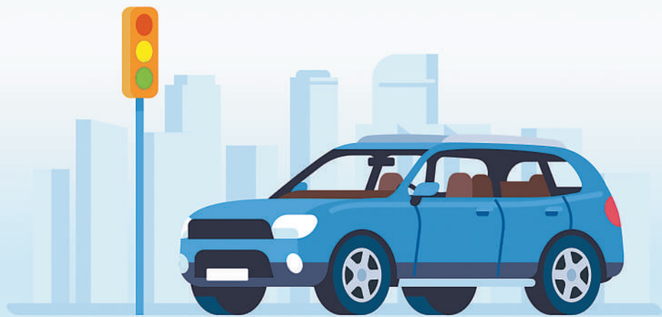
最高法发布民法典侵权责任编司法解释，自9月27日起施行

“《解释》就机动车投保义务人与交通事故责任人不是同一人的责任承担，贯彻严格的基调，强化法定义务的履行和违法制裁，更好地保护群众出行安全，保障被侵权人充分受偿。”最高法民一庭负责人表示。