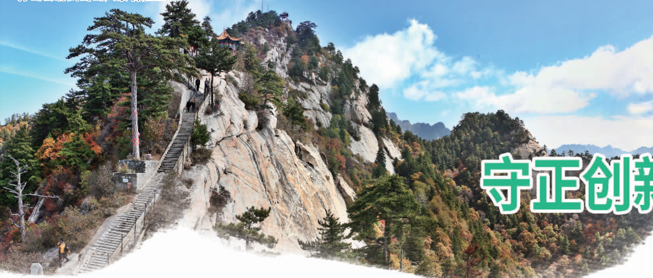
方山县北武当山风景名胜