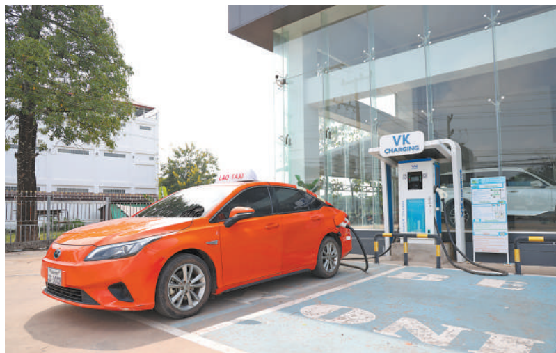
东南亚电动汽车市场正迎来快速增长期。图为老挝首都万象的一家电动汽车4S店前,一辆中国品牌电动出租车在充电。

德国巴登-符腾堡州太阳能和氢能研究中心近日发布的一份报告显示,2023年,全球电动汽车(包括纯电动汽车、插电式混合动力汽车和增程式电动汽车)保有量达到近4200万辆,比上年增长约50%。其中,中国电动汽车保有量约为2340万辆,占全球一半以上。据德国 Statista 数据平台统计,2024年,全球电动汽车市场营收有望达到7862亿美元,并将在2024—2029年间保持稳定的年复合增长率6.63%。业内人士认为,当前全球环保低碳理念越发深入人心,电动汽车领域技术快速迭代创新,预计2024年全年全球电动汽车销售将继续保持强劲增长势头。