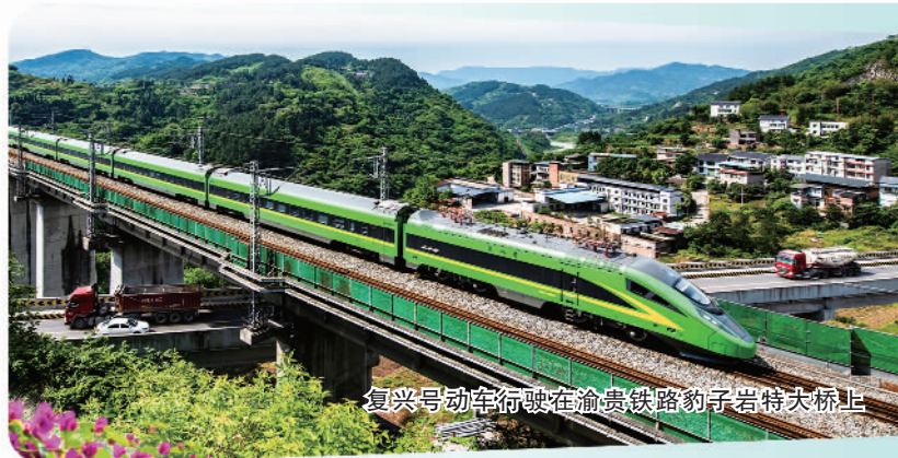
复兴号动车行驶在渝贵铁路豹子岩特大桥上