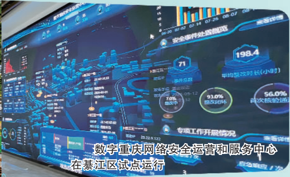
数字重庆网络安全运营和服务中心在綦江区试点运行