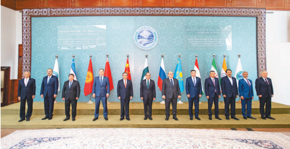
当地时间10月16日,国务院总理李强在伊斯兰堡出席上海合作组织成员国政府首脑(总理)理事会第二十三次会议。

本报伊斯兰堡10月16日电(记者陈尚文、程是颖)当地时间10月16日,国务院总理李强在伊斯兰堡出席上海合作组织成员国政府首脑(总理)理事会第二十三次会议。白俄罗斯总理戈洛瓦茨基、哈萨克斯坦总理托卡耶夫、吉尔吉斯斯坦总理扎帕罗夫、俄罗斯总理米舒斯京、塔吉克斯坦总理拉苏尔佐达、乌兹别克斯坦总理阿里波夫、印度外长苏杰生、伊朗工业和贸易部长阿塔巴克以及观察员蒙古国总理奥云额勒登、会议主办国客人土库曼斯坦副总理兼外长梅列多夫与会,巴基斯坦总理夏巴兹主持会议。