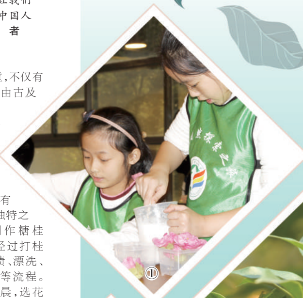
图①：孩子们在参加芙蓉主题科普活动。

“二十四城芙蓉花，锦官自昔称繁华。”芙蓉正次第绽放，它所代表的“福”和“容”，也融入成都的城市品格，装点着秋日的风光。