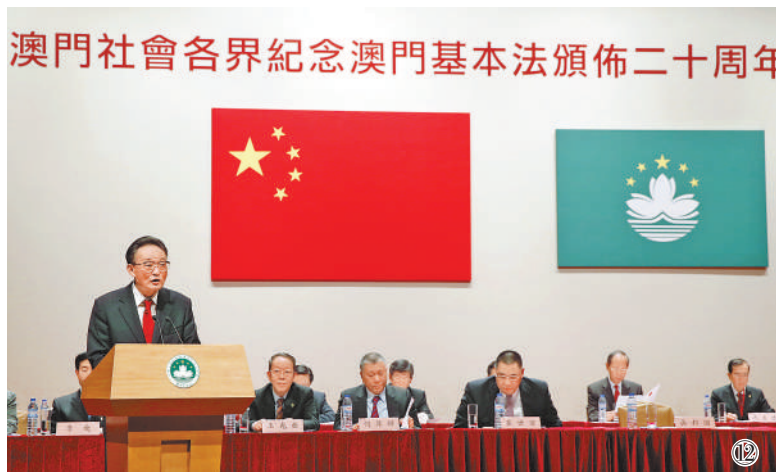
图⑫：2013年2月21日，吴邦国同志在澳门文化中心出席澳门社会界纪念澳门基本法颁布20周年启动大会并发表讲话。