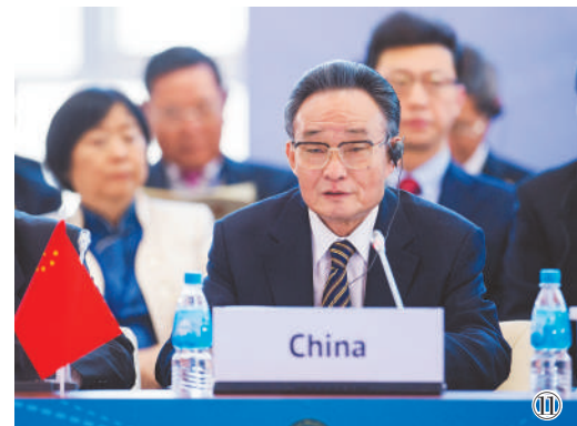
图⑪：2013年1月28日，吴邦国同志在俄罗斯符拉迪沃斯托克出席亚太议会论坛第21届年会，并作题为《坚持和平发展 促进合作共赢》的主旨发言。