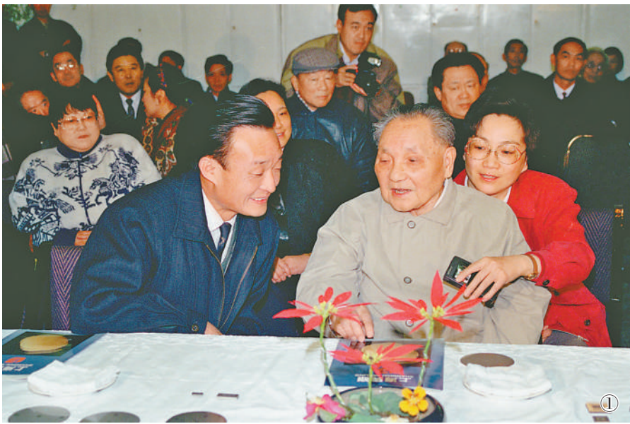
图①：1992年2月10日，邓小平同志在上海贝岭微电子制造有限公司参观时与吴邦国同志交谈。