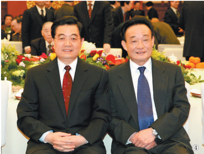
图④：二〇〇五年一月一日，全国政协在北京举行新年茶话会。这是胡锦涛同志与吴邦国同志在一起。