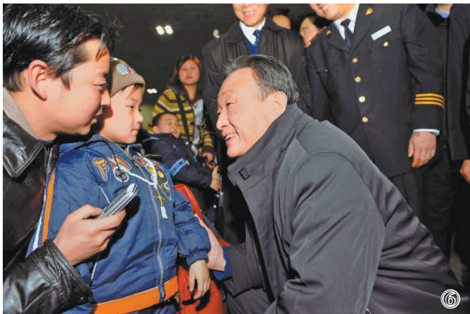
图⑥：2008年2月3日，吴邦国同志在北京西站候车室与旅客交谈。