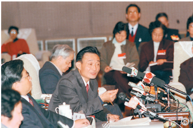
图⑤：1994年3月，时任上海市委书记的吴邦国同志在全国两会上海代表团全团会议上。新华社记者 刘建国摄