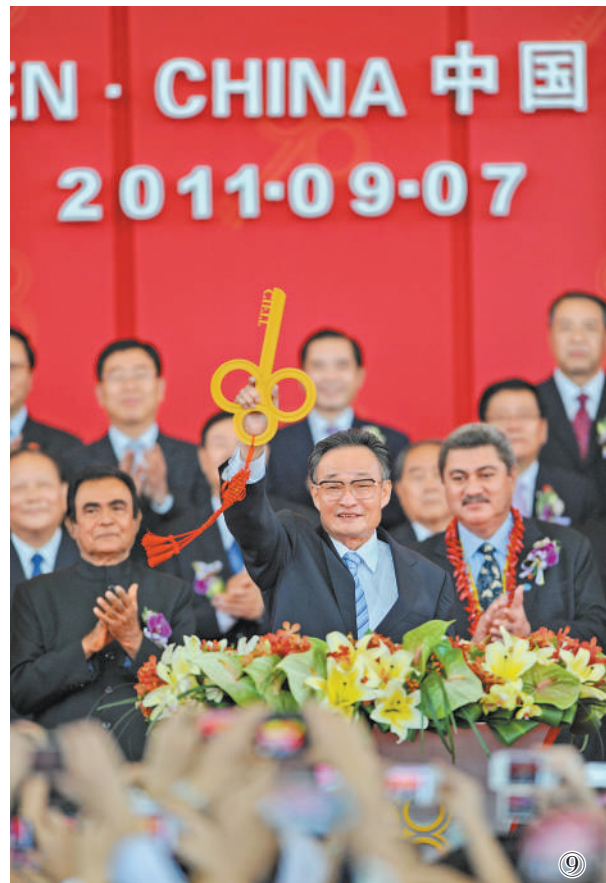
图⑨：二〇一一年九月七日，吴邦国同志在福建厦门出席第十五届中国国际投资贸易洽谈会开幕式。新华社记者 张国俊摄