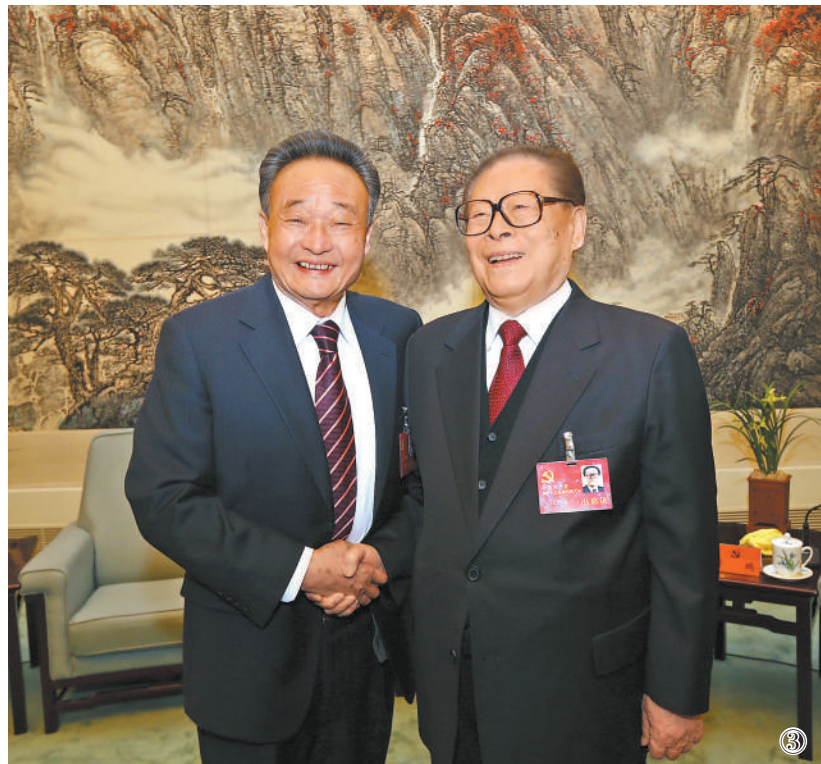
图③：2012年11月14日，中国共产党第十八次全国代表大会在北京闭幕。这是闭幕会前，江泽民同志与吴邦国同志在一起。