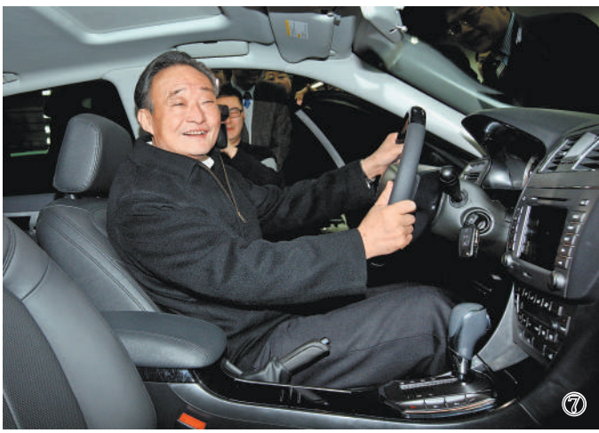
图⑦：2010年1月30日，吴邦国同志在上海汽车集团股份有限公司技术中心察看新能源车。