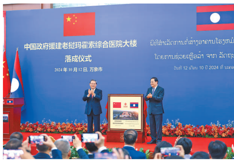
当地时间10月12日，国务院总理李强在万象同老挝总理宋赛共同出席中国政府援建老挝玛霍索综合医院大楼落成仪式。

宋赛表示，玛霍索综合医院项目是意义非凡的民生工程，由老中两党两国最高领导人共同奠基，对于老挝进一步改善医疗条件、保障人民健康发挥了重要作用，成为老中传统友谊与合作的标志性项目。方感谢中方长期以来对老挝经济社会