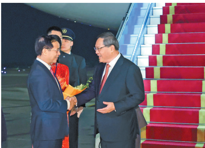
10月12日晚，应越南总理范明政邀请，国务院总理李强乘包机抵达河内内排国际机场，开始对越南进行正式访问。

李强是在结束出席东亚合作领导人系列会议并正式访问老挝后抵达河内的。离开万象时，老挝计划投资部长、老中合