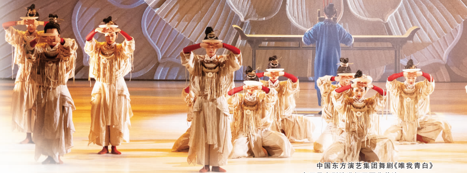
中国东方演艺集团舞剧《唯我青白》在开元大剧院进行了西北首演