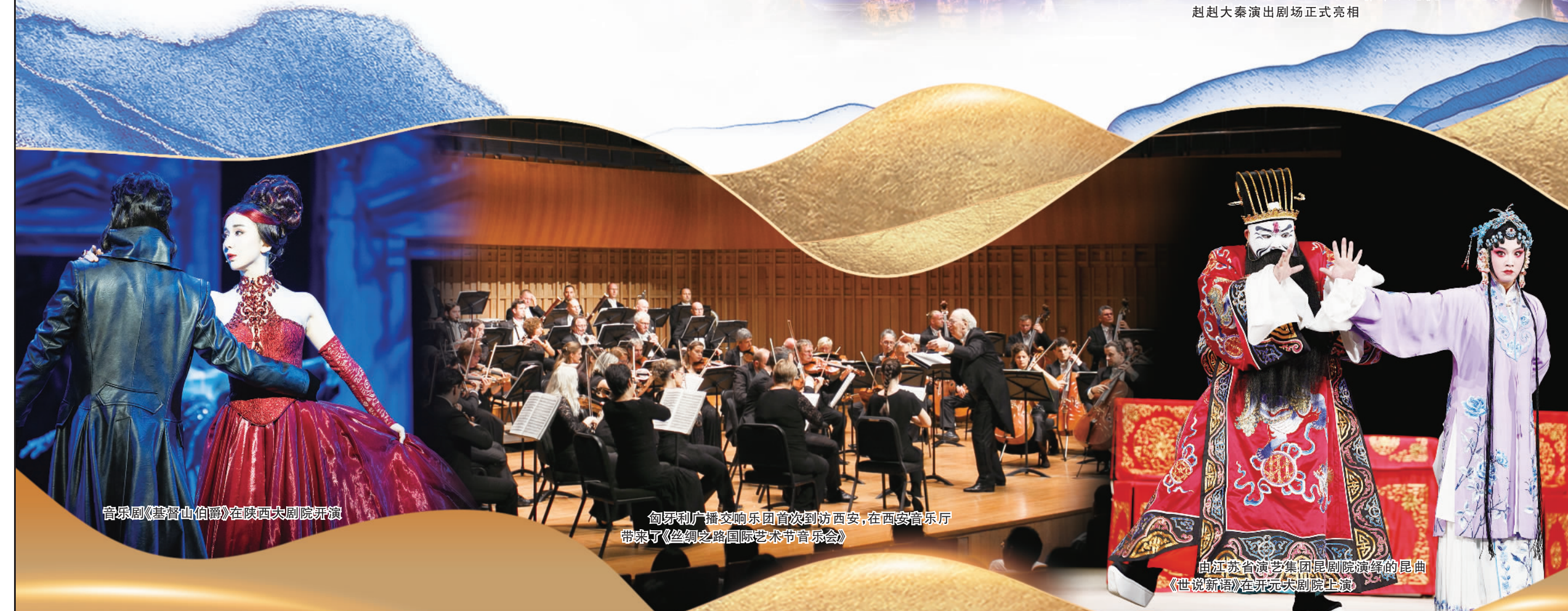
音乐剧《魔笛》在陕西大剧院开演