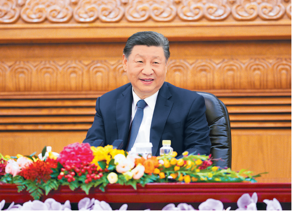
十月十一日上午,国家主席习近平在北京人民大会堂集体会见出席中国国际友好大会暨中国人民对外友好协会成立70周年纪念活动的外方嘉宾。