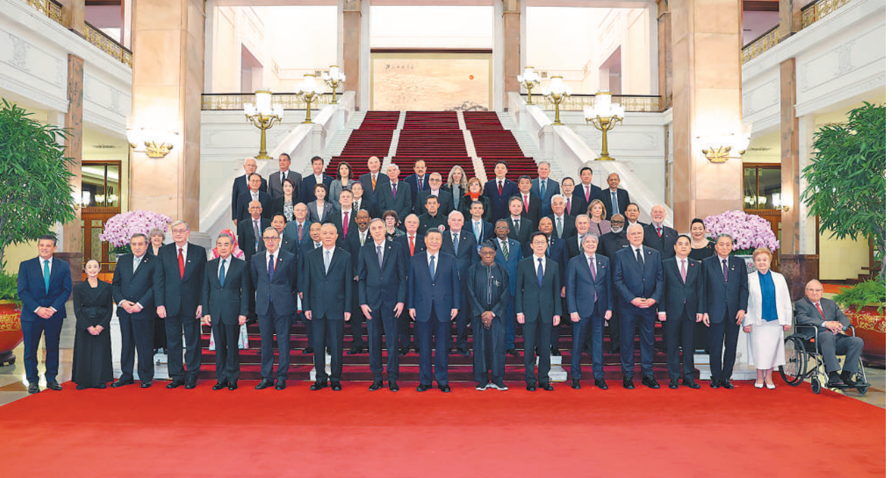
10月11日上午,国家主席习近平在北京人民大会堂集体会见出席中国国际友好大会暨中国人民对外友好协会成立70周年纪念活动的外方嘉宾。这是习近平同部分外方嘉宾代表合影留念。

人民友好是国际关系行稳致远的基础,是促进世界和平发展的不竭动力。中华人民共和国成立75年来,中国共产党团结带领中国人民,走出了一条既发展自身又造福世界的现代化之路。回首来时路,中国取得的各方面成就离不开世界各国的支持。一大批国际友人同中国人民风雨同舟、同甘共苦,众多外国企业、机构、个人积极参与中国社会主义现代化建设,不仅实现了各方互利共赢,也为促进中外友好交流合作作出重要贡献。我们将始终铭记大家为中国作出的重要贡献和同中国人民的真挚友谊。 当今世界又一次站在历史的十字路口。百年变局之下,全球休戚相关,人类命运与共,构建人类命运共同体是世界各国人民前途所在。中国愿同各国朋友加强友好交流,发挥民间外交独特作用,携手构建人类命运共同体。 一是要以“同球共济”的精神,凝聚推动构建人类命运共同体的广泛共识。二是要以合作共赢的理念,汇聚推动构建人类命运共同体的强大合力。三是要以开放包容的胸襟,绘就推动构建人类命运共同体的文明画卷。 中国共产党是为人民服务的党,中国政府是人民的政府,中国外交是人民的外交。中国政府将一如既往地支持中国人民对外友好协会在发展中外人民友谊、促进国际务实合作等方面发挥独特作用,以友为桥,以心相交,不断深化中外民间友好,团结各国朋友,共同做人类命运共同体的践行者、中国式现代化的参与者、文明互鉴和民心相通的促进者和人民友好事业的传承者。